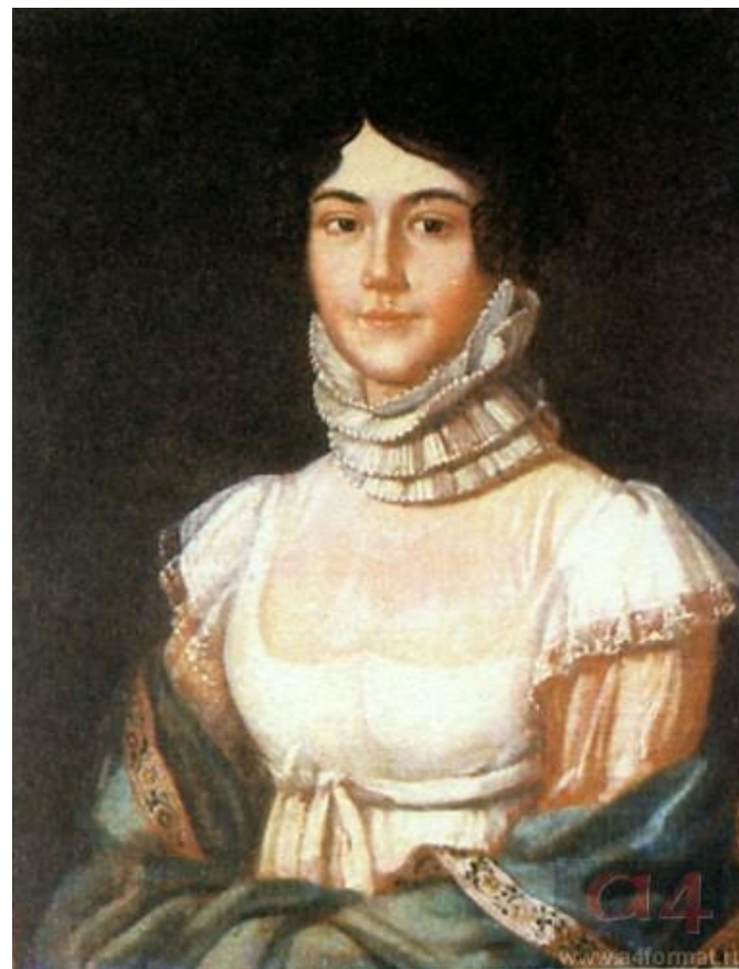
Мария Михайловна Лермонтова (1795—1817)