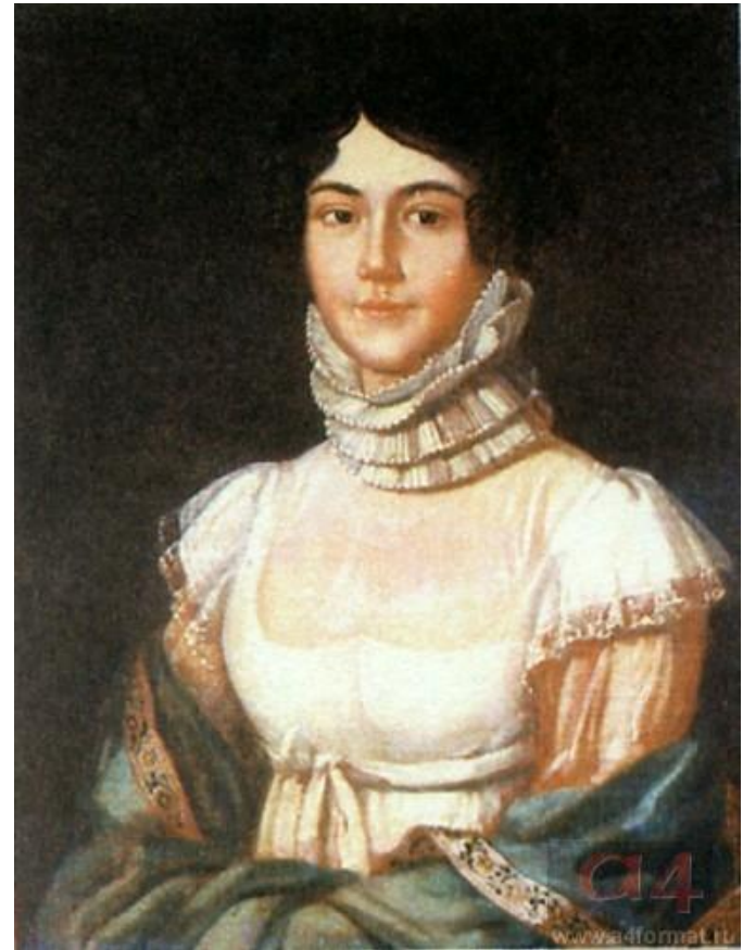
Мария Михайловна Лермонтова (1795—1817)