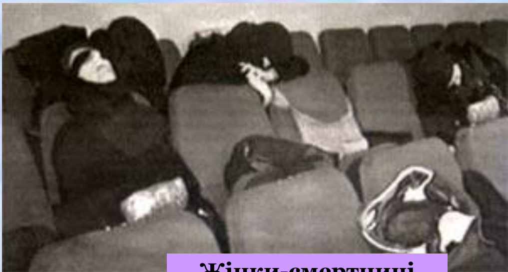
Жінки-смертниці обвішані вибухівкою