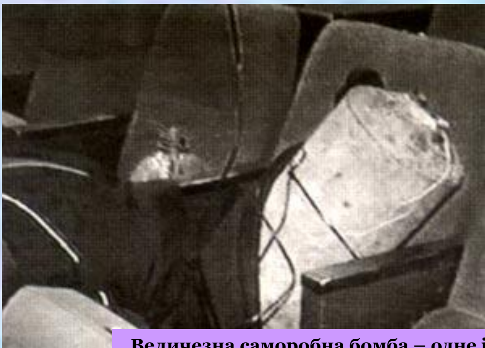
Величезна саморобна бомба – одне із найсильніших вибухових пристроїв, що знаходилися у глядацькому залі

23 жовтня будівля театру у московському кварталі Дубровка група з 40 терористів захопила 800 глядачів та працівників театру. У той вечір давали один із найпопулярніших вистав сезону – мюзикл «Норд-Ост».