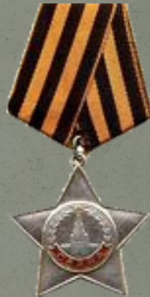
Орден за Славу