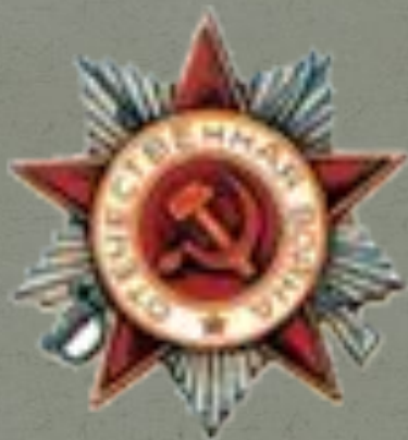
Орден за Отечественную войну