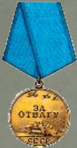
Орден за Отвагу