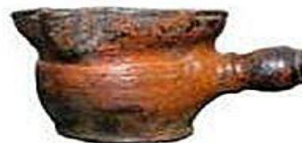
ГОРШОК ДЛЯ ТОПЛЕНИЯ МАСЛА