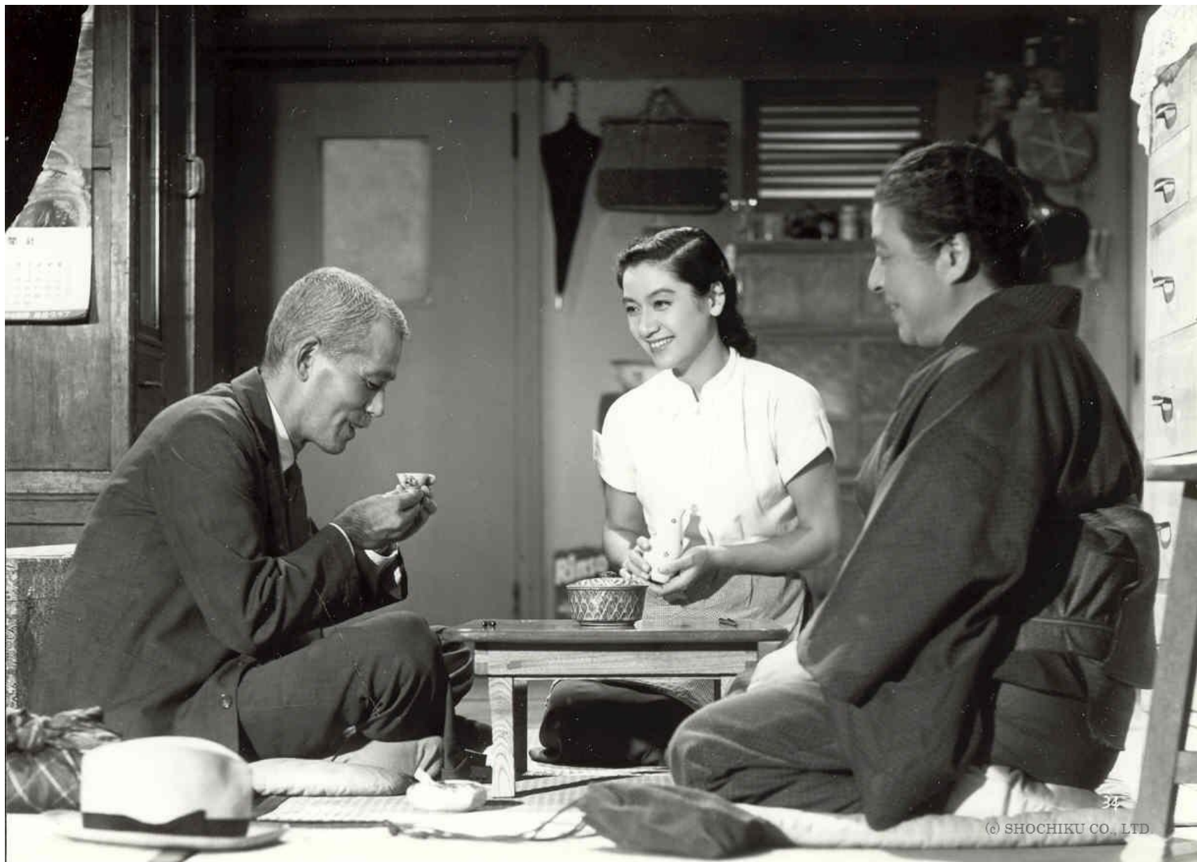
Токийская повесть. 1953