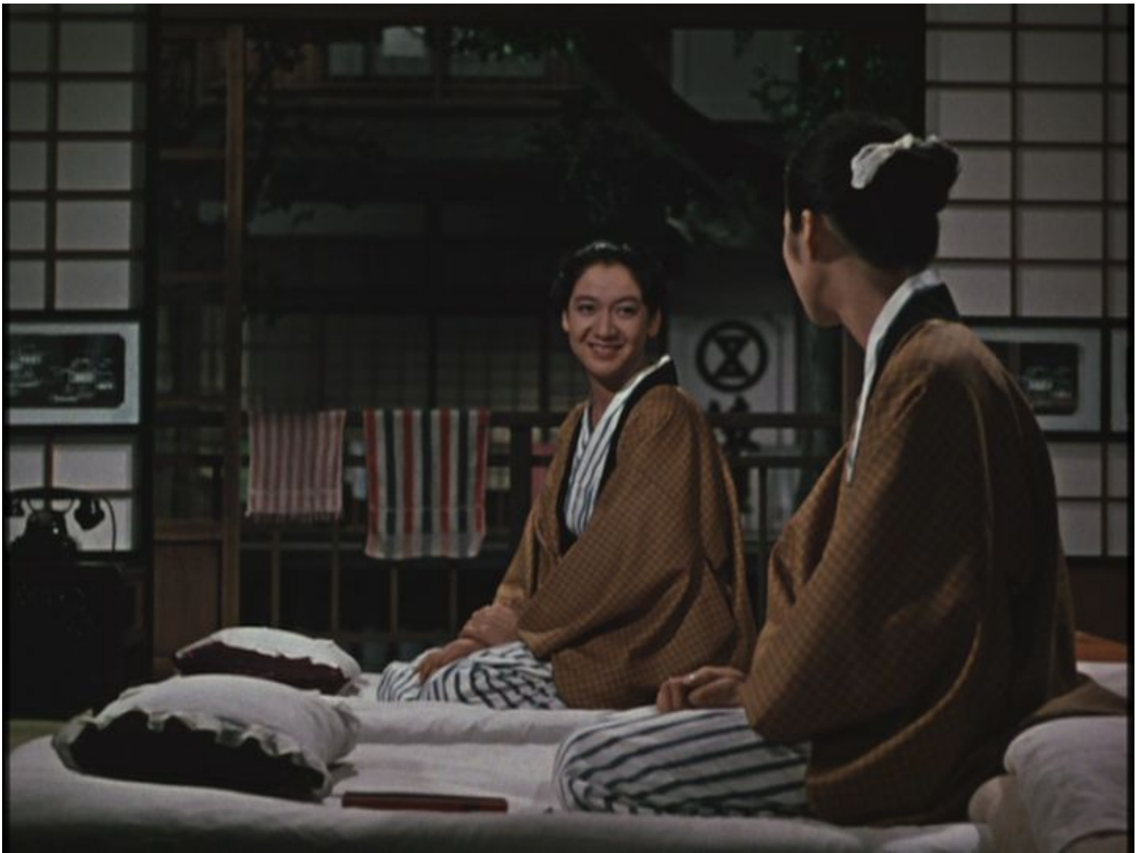
Поздняя осень. 1960