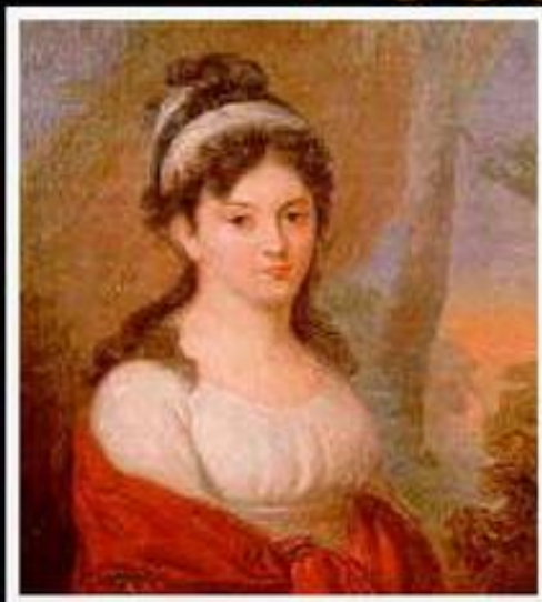
Е. А. Тютчева, мать поэта 1776-1866