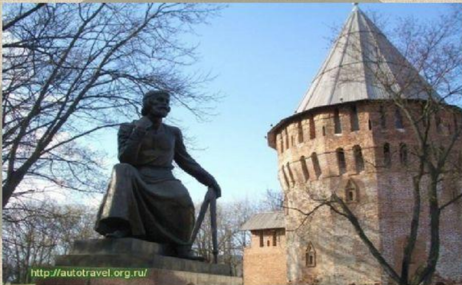
Памятник русскому зодчему – Фёдору Коню в Смоленске