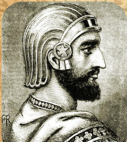
Кир II Великий