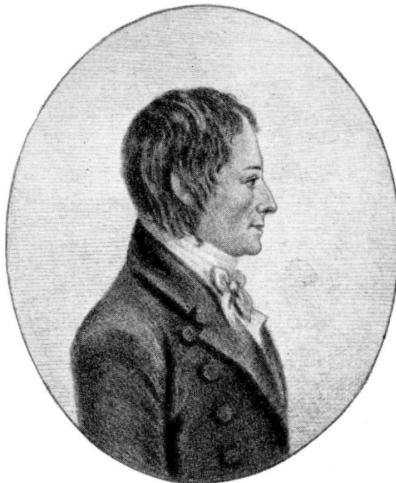
A. G. Ekeberg. Gravyr av A. U. Berndes efter teckning av J. E. Roos.