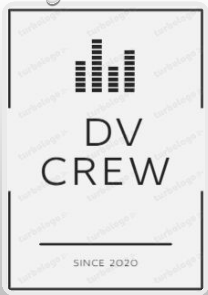
Логотип компании DV Crew