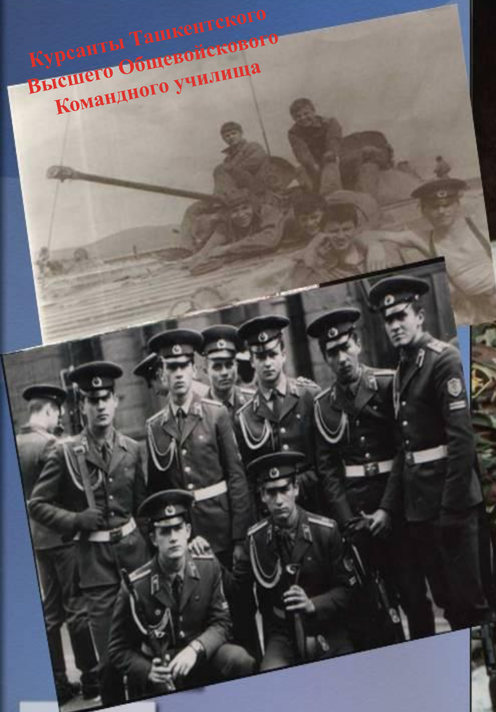
Курсанты Ташкентского Высшего Общевоинского Командного училища