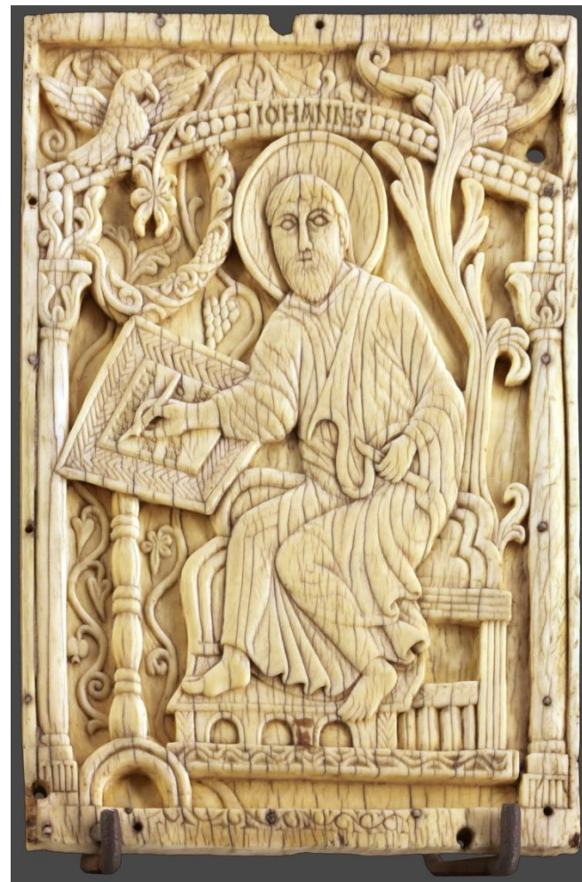
Матфей Евангелист, ап. Иоанн Евангелист, ап. Убранство рукописной книги. Кость; резьба по кости. Север Италии. X в.

Музей изобразительных искусств. Лион. Франция.