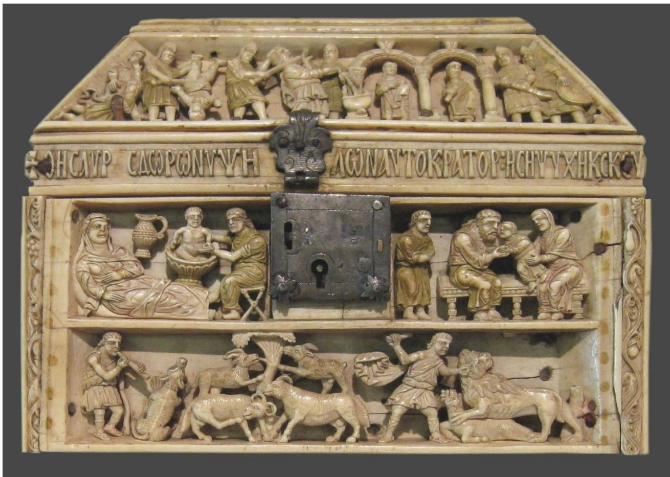
Сцены из истории Давида пророка. Шкатулка (12 x 6.2 см). Кость; резьба по кости. Византия. XI в.