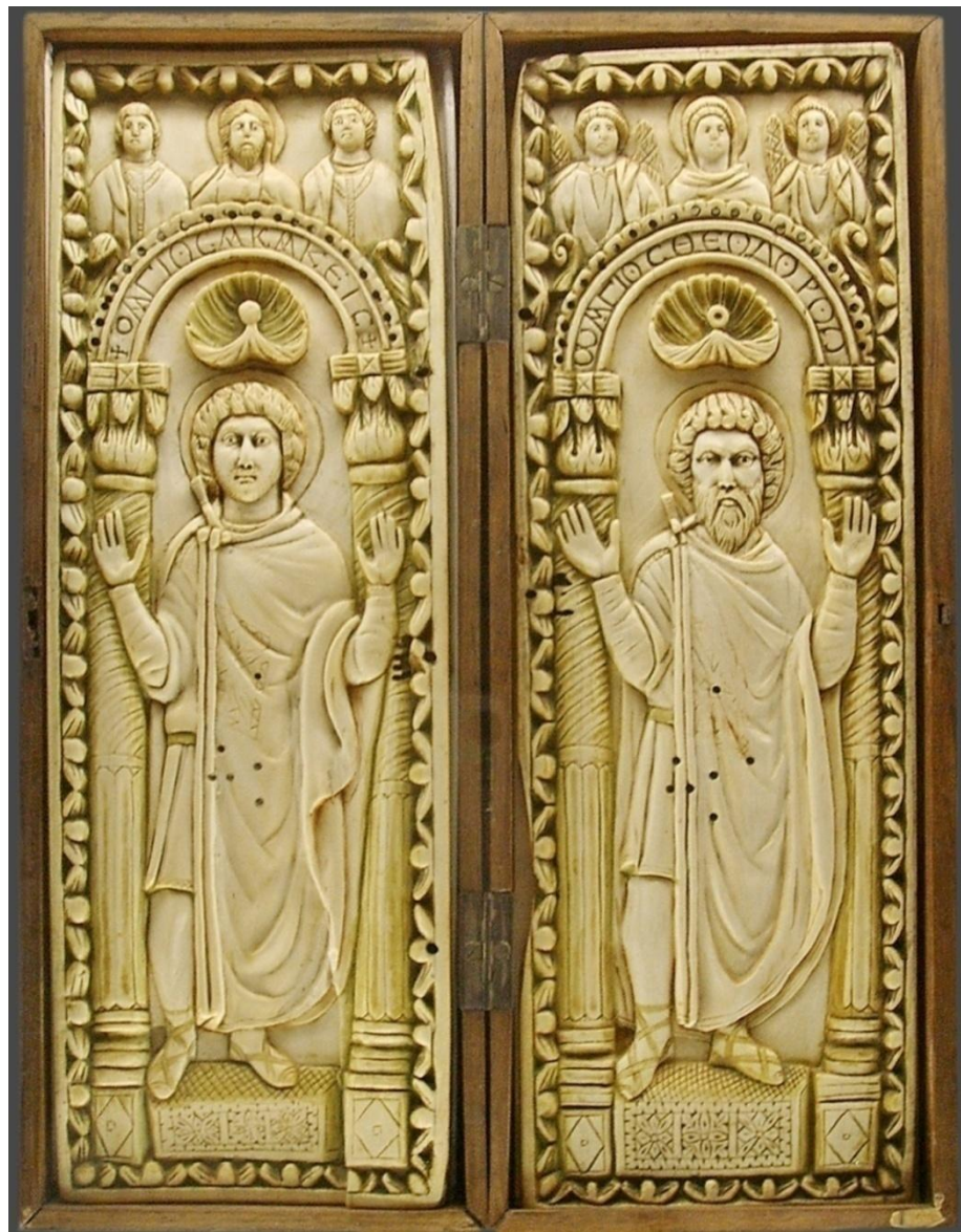
Мч. Акакий Каппадокияни и вмч. Феодор Стратила. Дерево, кость; резьба по кости. Константинополь. Византия. V в.

Городской музей «Ала Понцоне». Кремона. Италия.