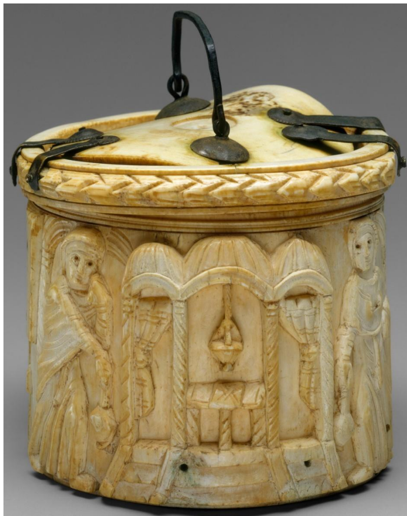
Жены-мироносицы у Гроба Господня. Дарохранительница (12.1x12.7 см). Кость, серебро; ковка, резьба по кости. Византия. VI в.