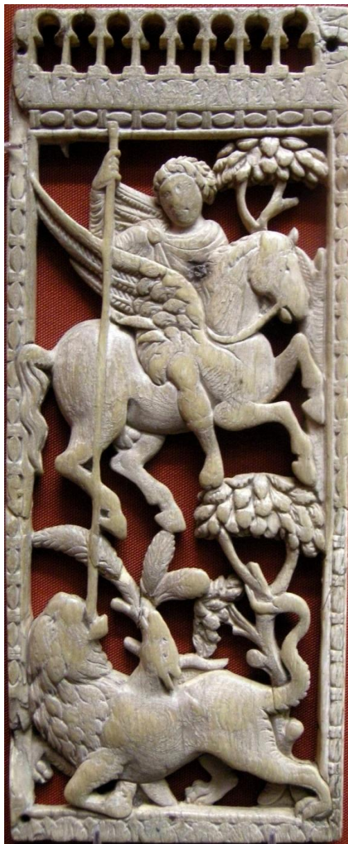
Беллерофонт убивает химеру (8.8x21.2 см). Кость; резьба по кости. Римская Империя. V в.