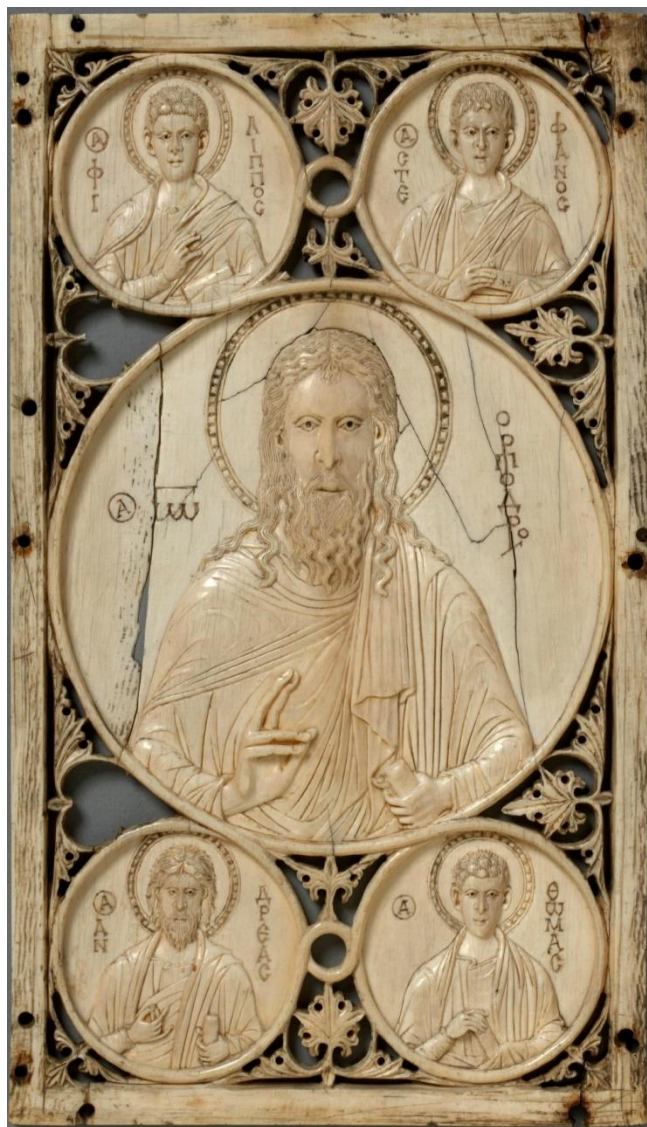
Прор Иоанн Предтеча, апостолы Фома, Андрей, Филипп и архидиакон. первомуч. Стефан. Икона резная (13.3 x 23.2 см). Кость; резьба по кости. Константинополь. Византия. X в.

Музей Виктории и Альберта. Англия. Лондон.