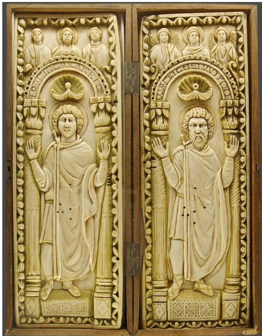
Мч. Акакий Каппадокияни и вмч. Феодор Стратила. Дерево, кость; резьба по кости. Константинополь. Византия. V в.

Городской музей «Ала Понцоне». Кремона. Италия.