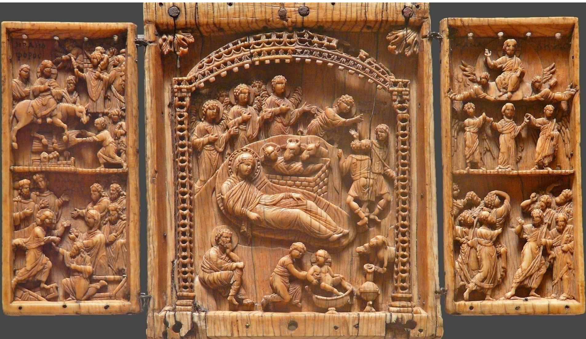
Рождество Христово с библейскими сценами. Вход Господень в Иерусалим. Схождение во ад (Воскресение Христово). Вознесение Господне. Триптих (20x12.1 см).

Кость; резьба по кости. Константинополь. Византия. X в.