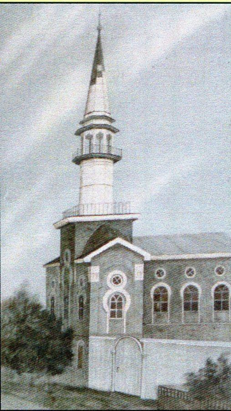
Мечеть г. Вятка. Начало XX в.