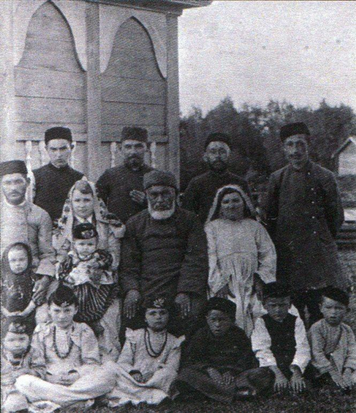
Семья муллы из д. Карино Слободского уезда. Начало XX в.