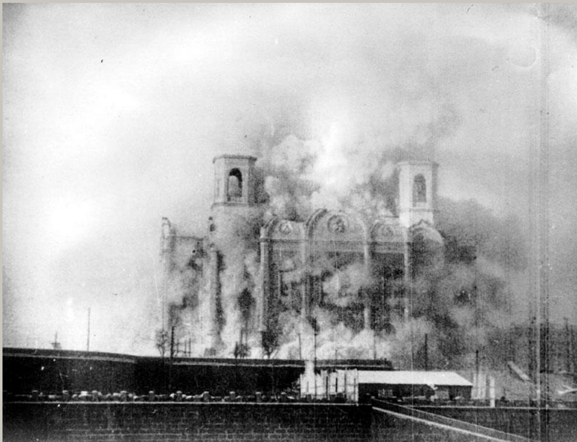
Разрушение Храма Христа Спасителя (1931)