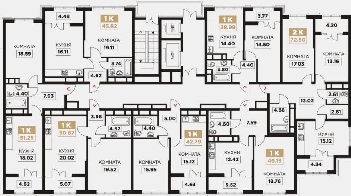
ДОКУМЕНТИ ЛНKK СЕР БУК