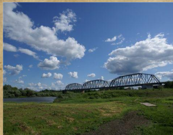
Голубой мост - сегодня