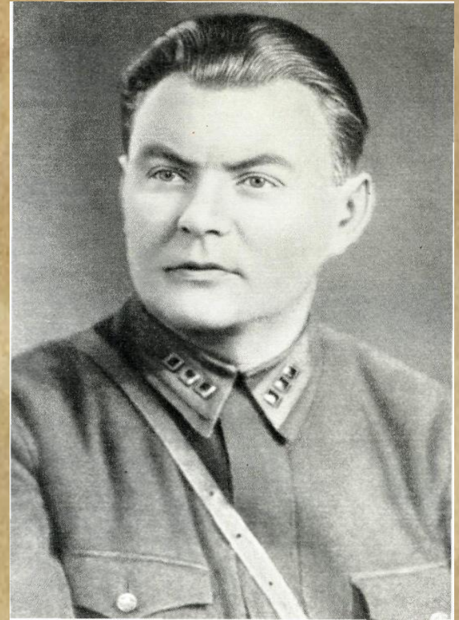
А.В. Софронов – автор текста