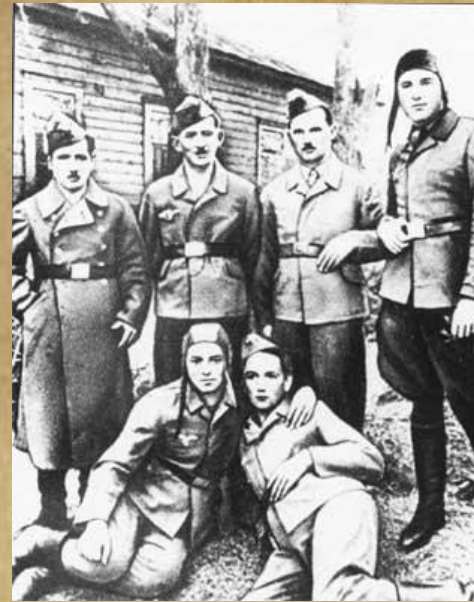
Поляки – участники Сещинского подполья