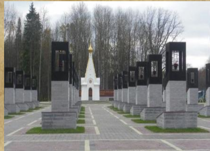
Мемориальный комплекс Хацунь, возведенный на месте трагедии