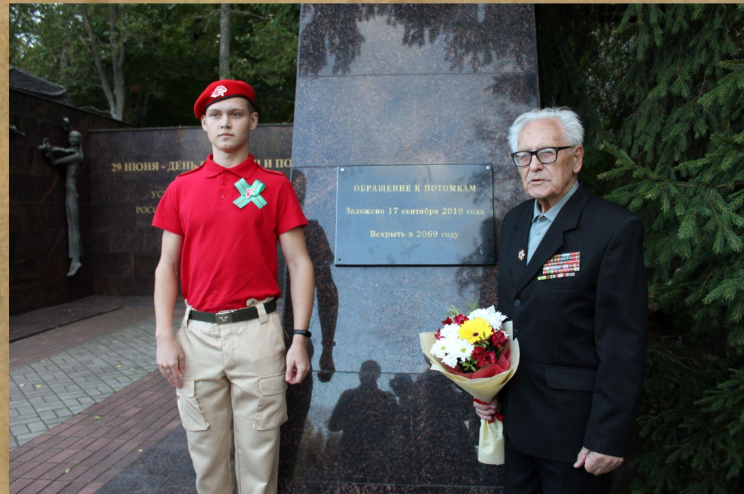
Закладка капсулы, с посланием к потомкам. Вскрыть в 2069 году