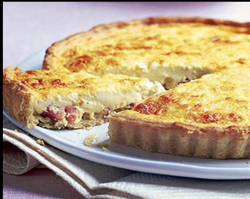
La Quiche Lorraine ▶