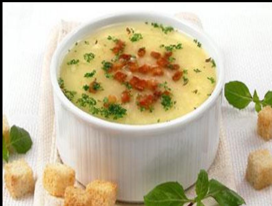
◀ La soupe au lard