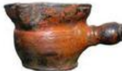
ГОРШОК ДЛЯ ТОПЛЕНИЯ МАСЛА