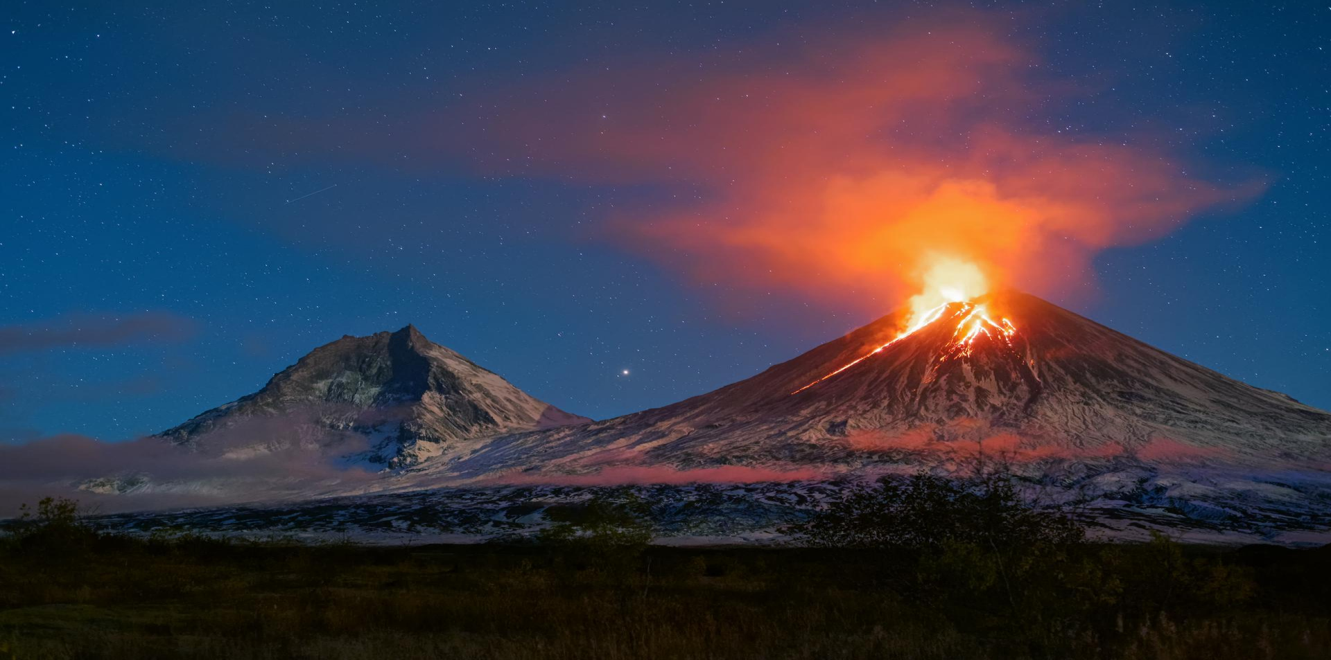
Действующий вулкан Ключевская сопка. Камчатка.