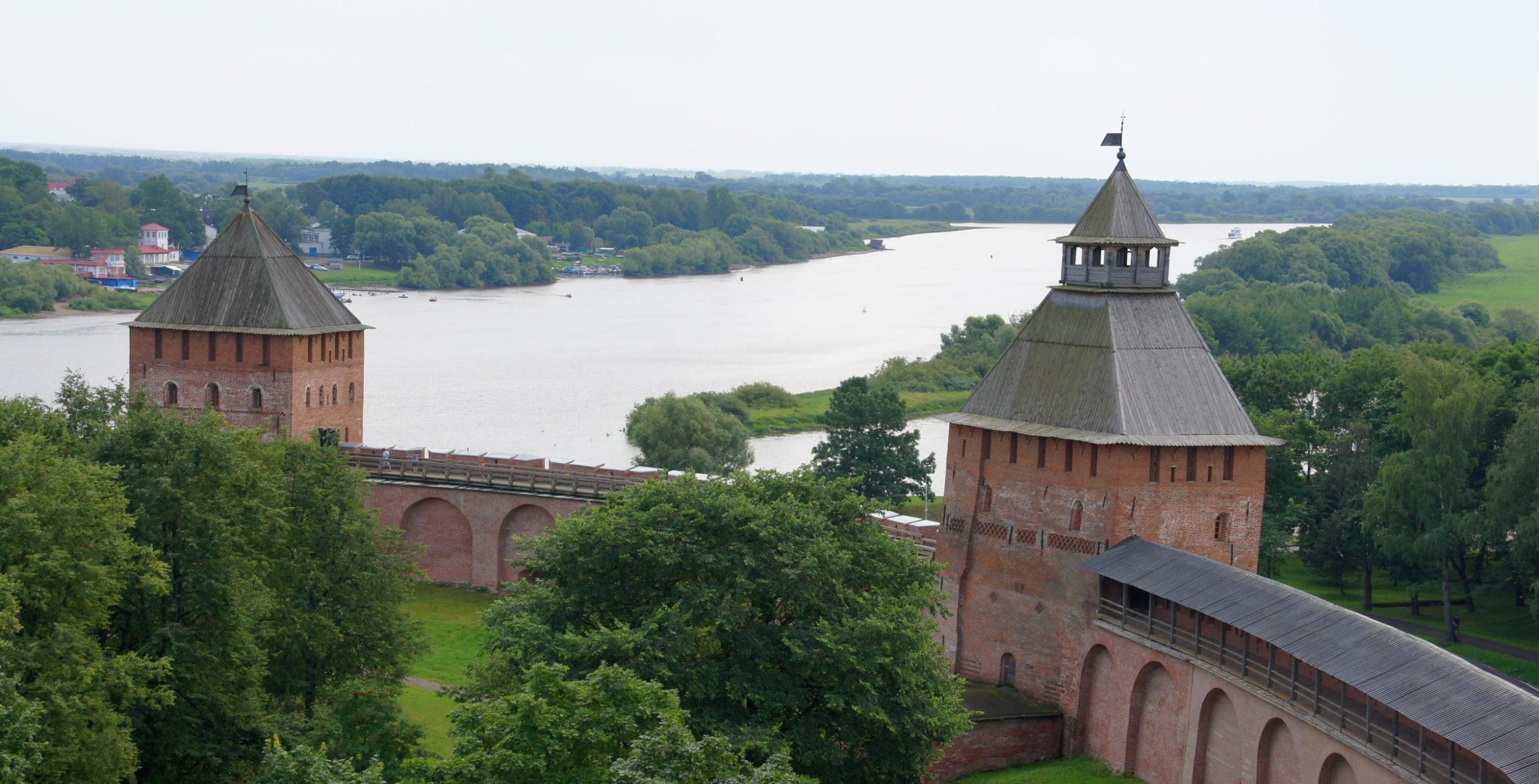
Ансамбль Новгородского Кремля: Великий Новгород.