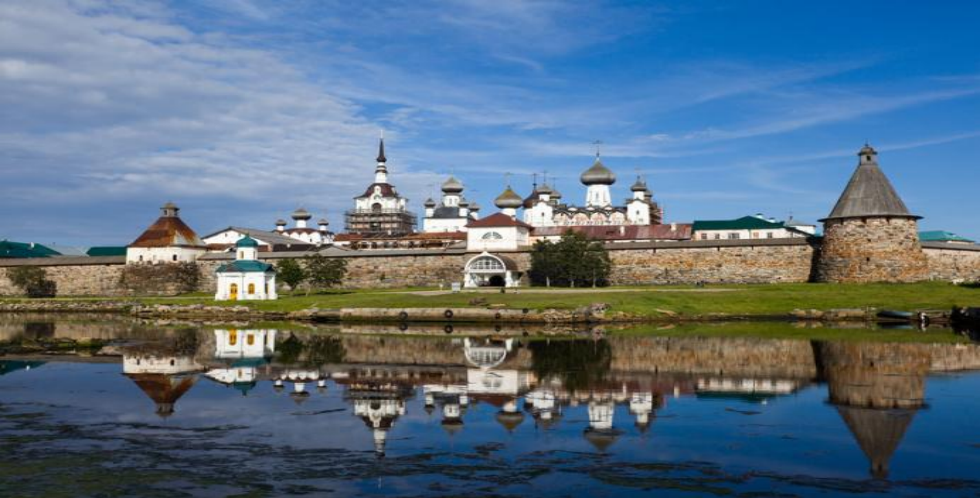
Ансамбль « Соловецкие острова ».