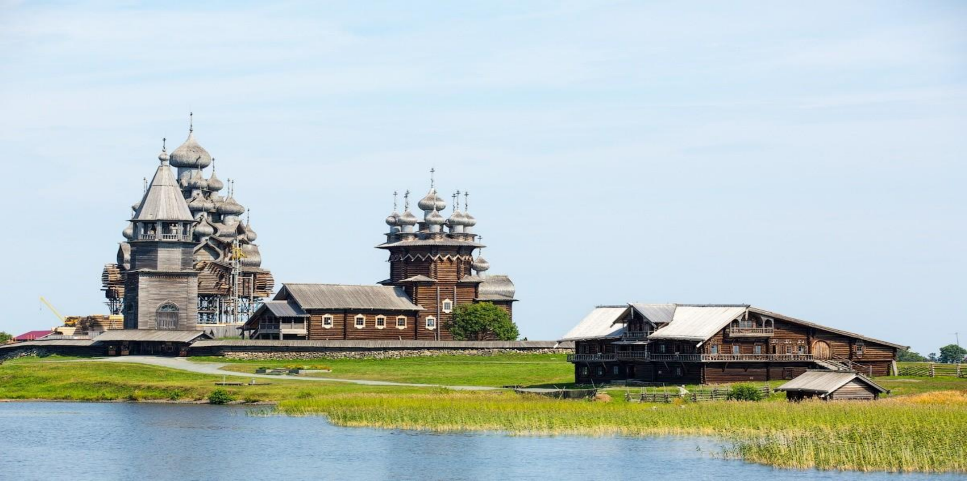
Архитектурный ансамбль Кижского погоста.