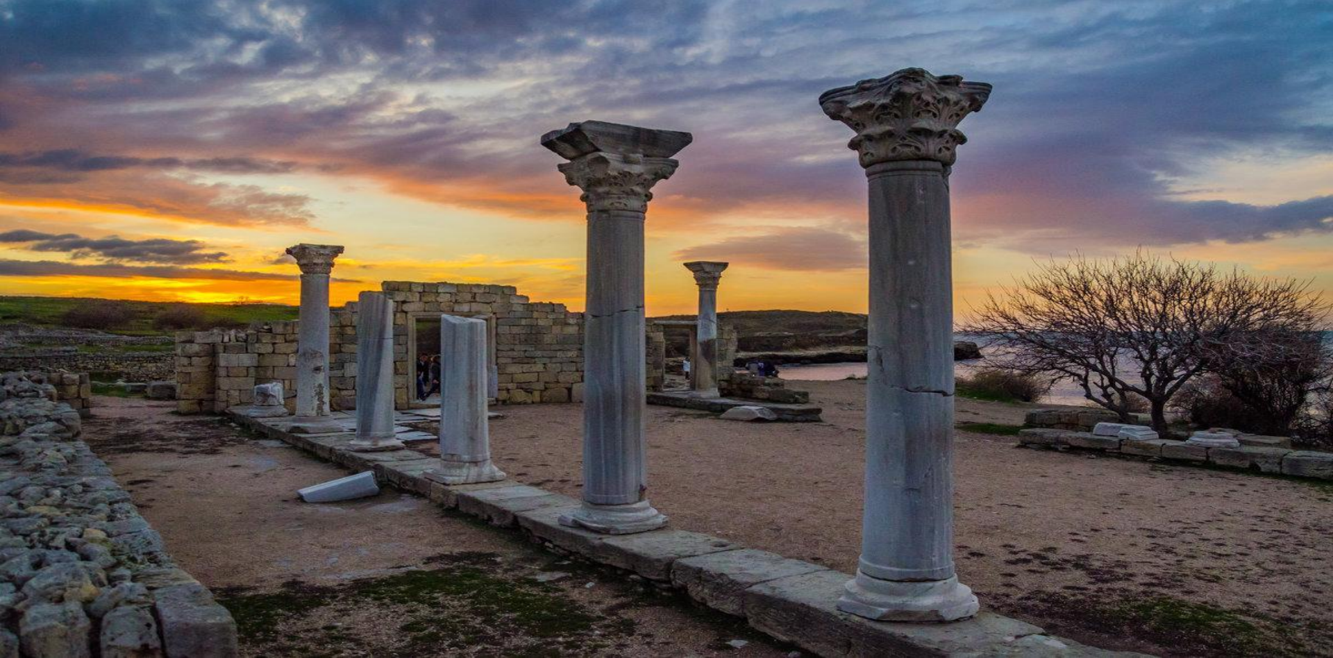
Древний город Херсонес, Крым.