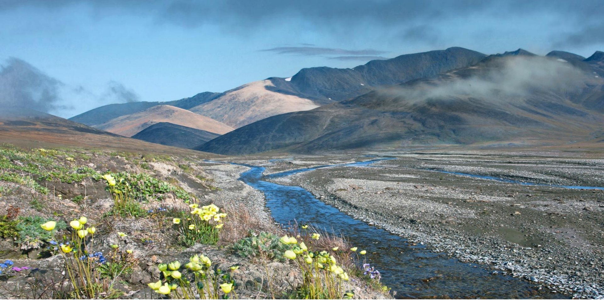
Остров Врангеля, Иультинский район.