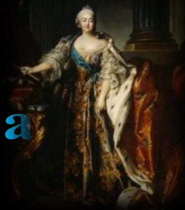
Елизавета Петровна (1741-1762)