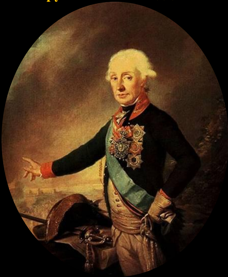
Суворов А. В.

В сражениях Семилетней войны происходит становление талантливых русских полководцев П.А. Румянцева и А.В. Суворова.