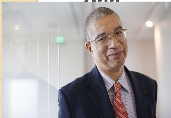
Премьер- министр, кәсіпкер-Лионель Зинсу