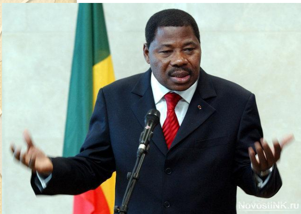
Президент- Бони Яйи