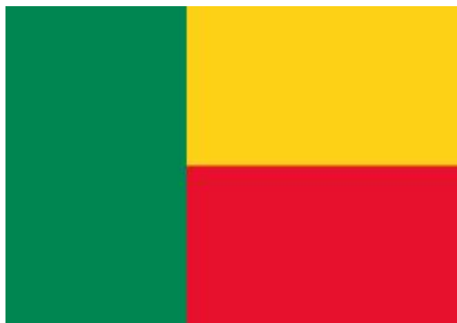
Бенин республикасының туы