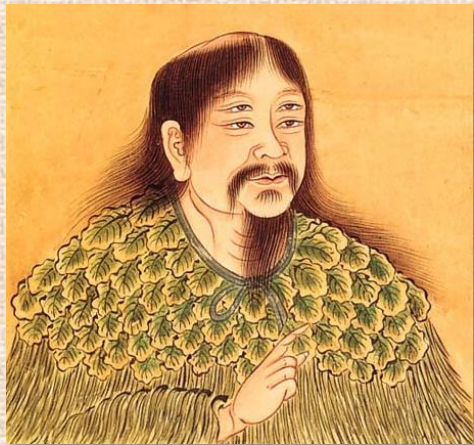
Цан Цзе 倉頡