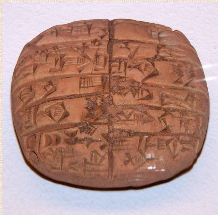
Накладная о выдаче зерна для посева и корма пахотным ослам