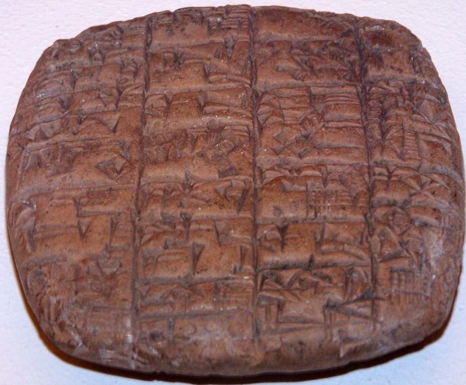
Договор продажи в рабство за долги