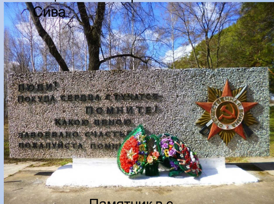
Памятник в с.