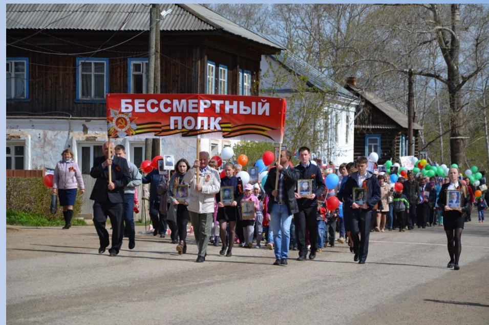
Акция «Бессмертный полк в с. Сива»