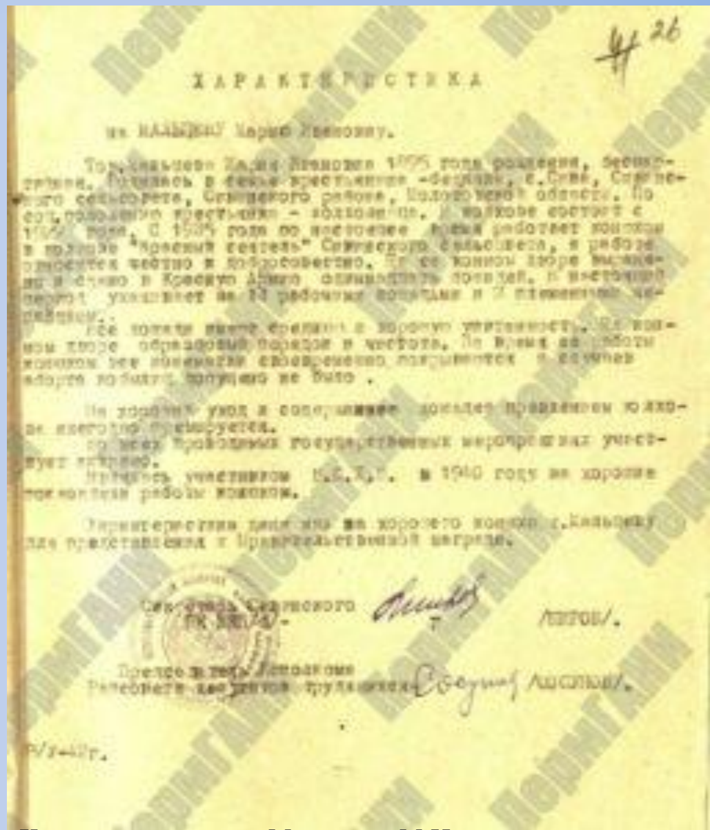
Характеристика на Мальцеву М.И. – конюха колхоза «Красный сеятель» Сивинского района Молотовской области для представления к правительственной награде