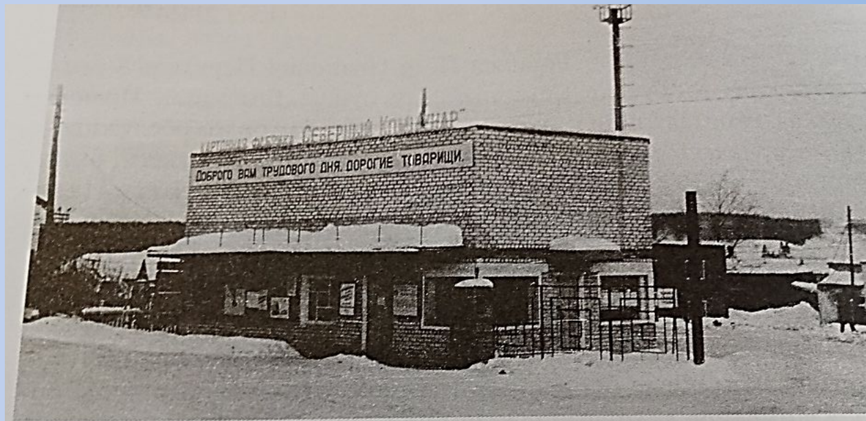
Проходная фабрики «Северный коммунар»

Из посёлка Северный Коммунар ушли на фронт более 240 человек, вернулись 130, многие с тяжёлыми ранениями.