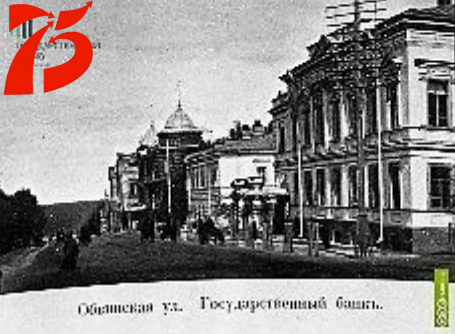
Общественная ул. Государственный банк.

В Сивинское отделение Госбанка в 1942 г. поступило: