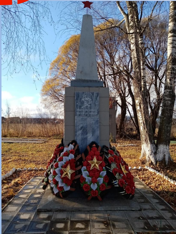
Памятник в п. Северный Коммунар