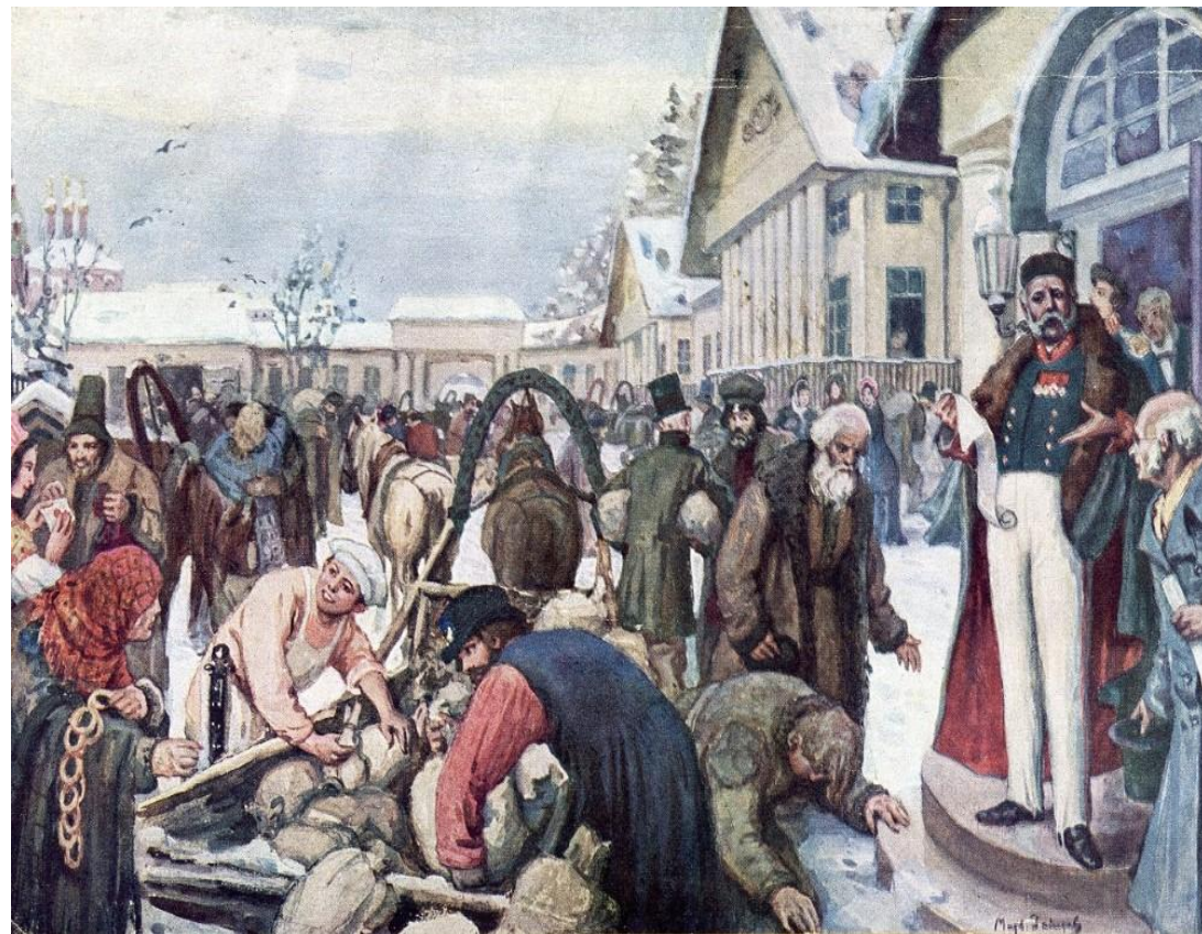
Налог на бороды.