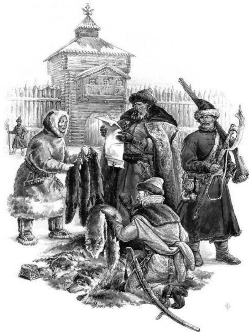
Сбор ясака казаками.