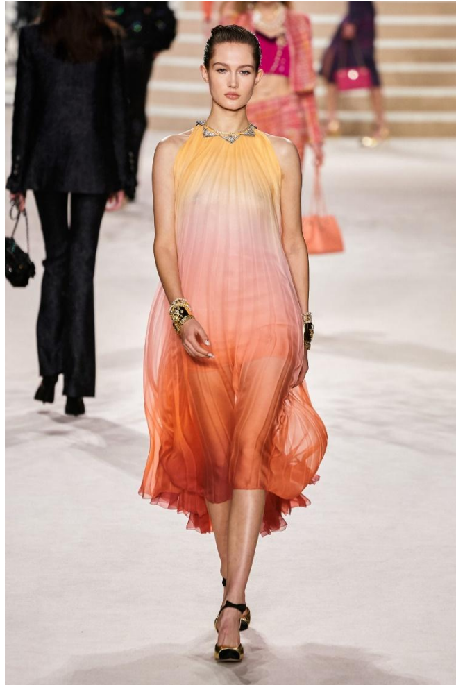
расширенный к низу