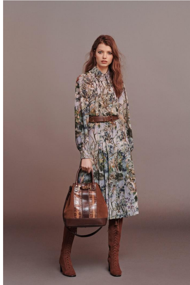
На естественном уровне