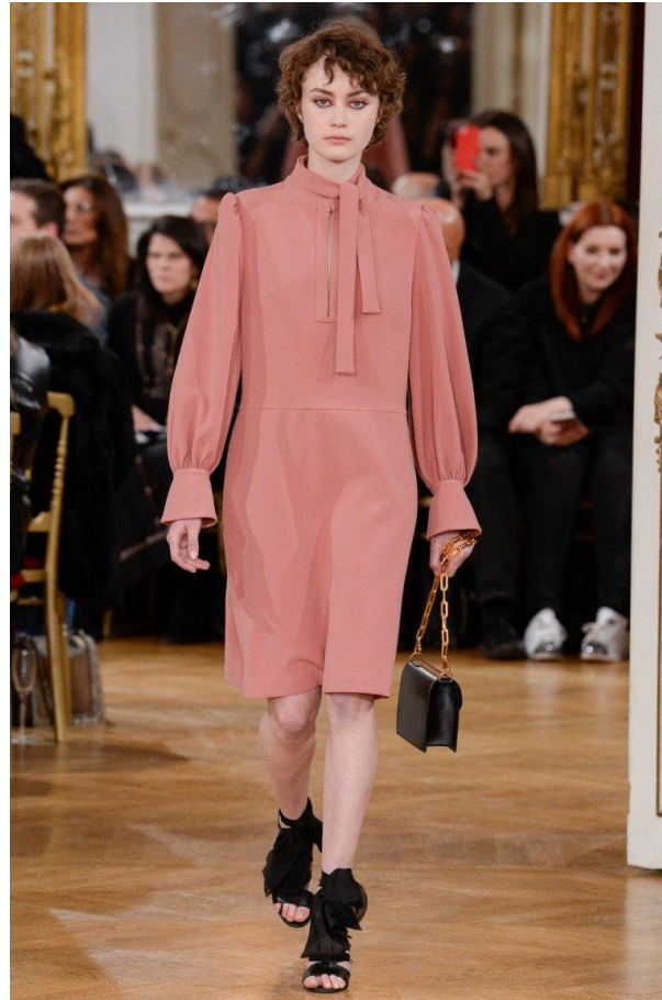
Не четко выраженная