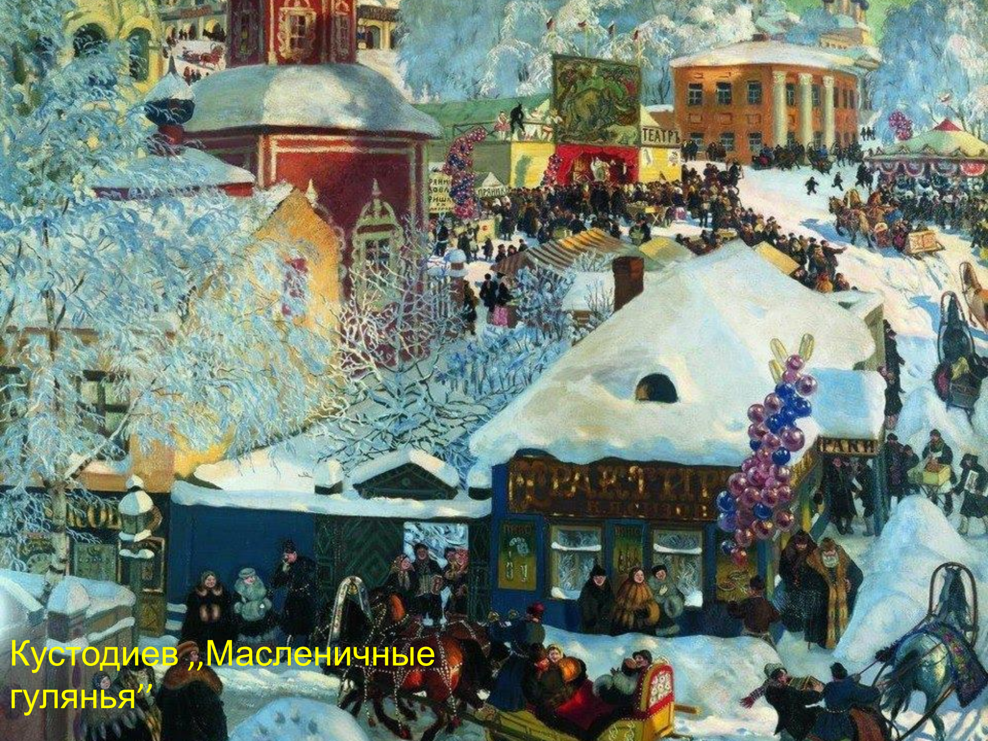
Кустодиев „Масленичные гулянья”