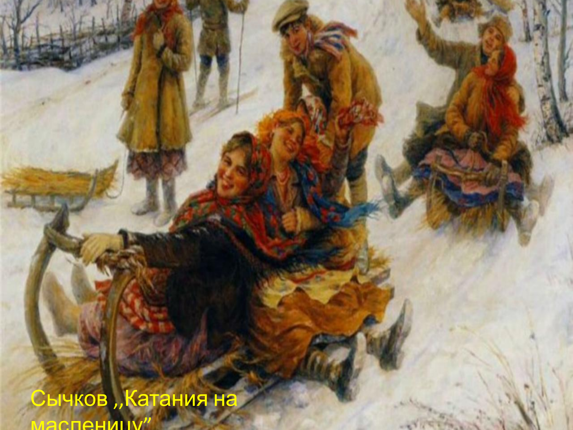
Сычков „Катания на маспеници“