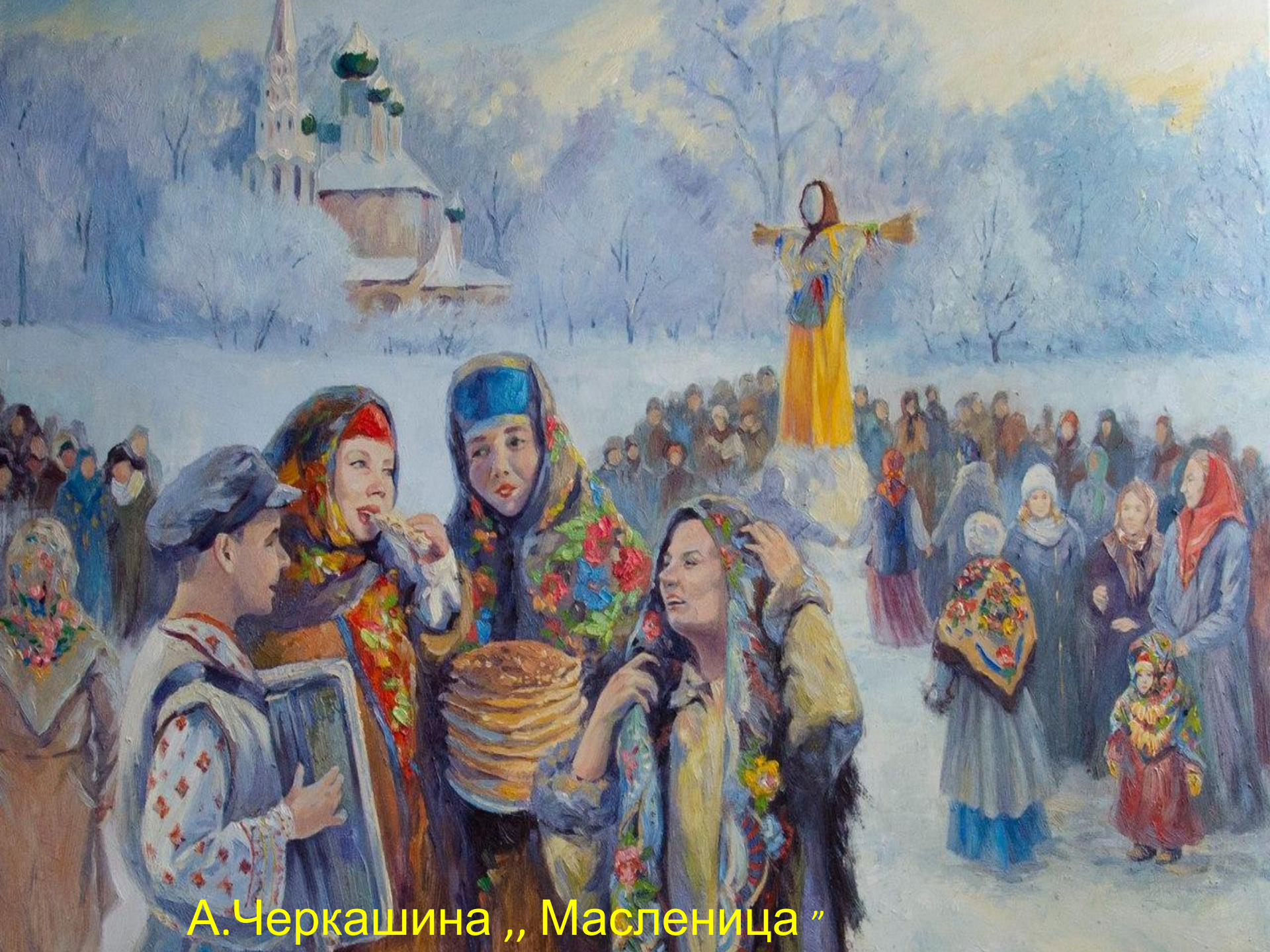
А.Черкашина „ Масленица ”