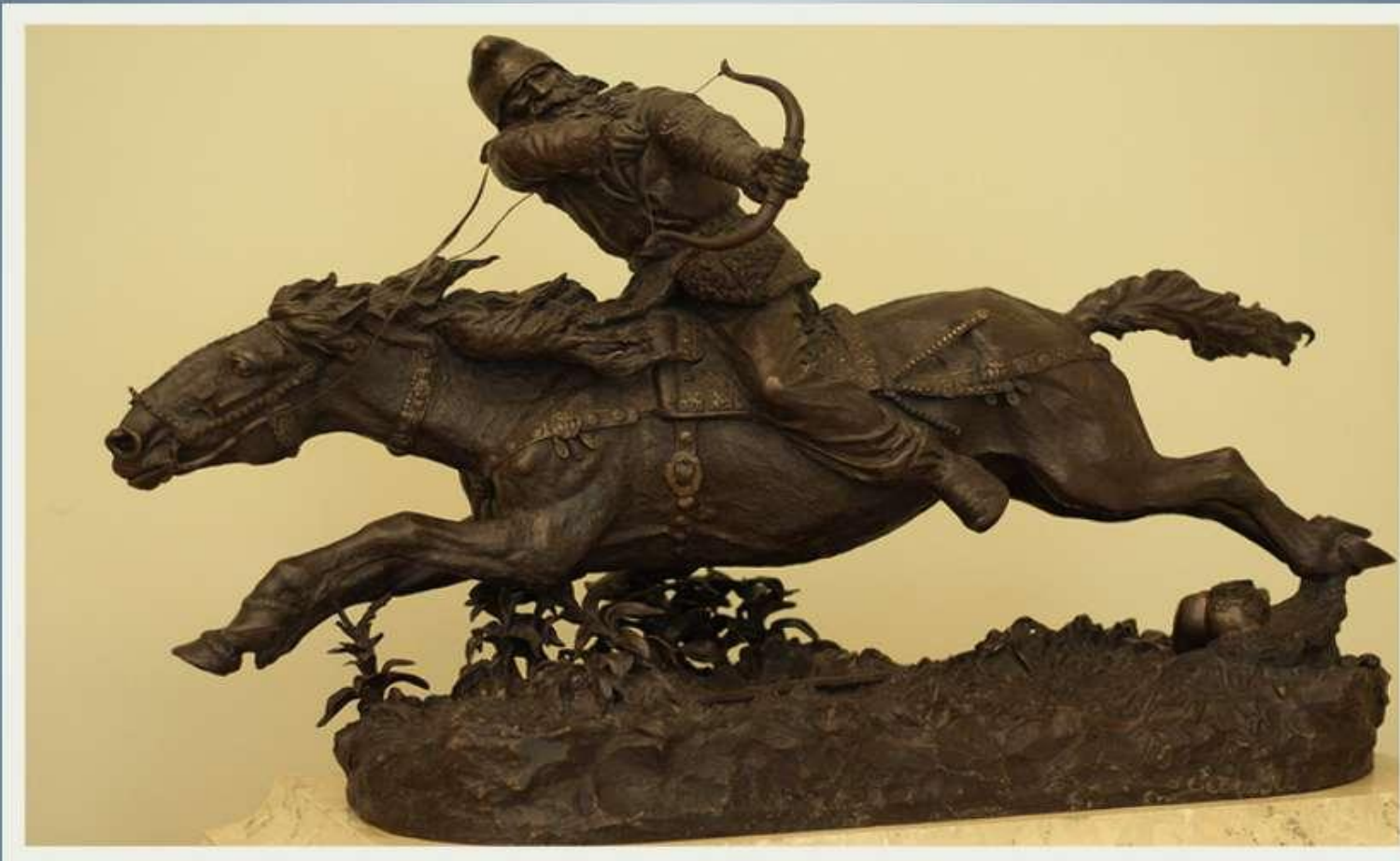
«Скіф», 1889 р. Російський музей.