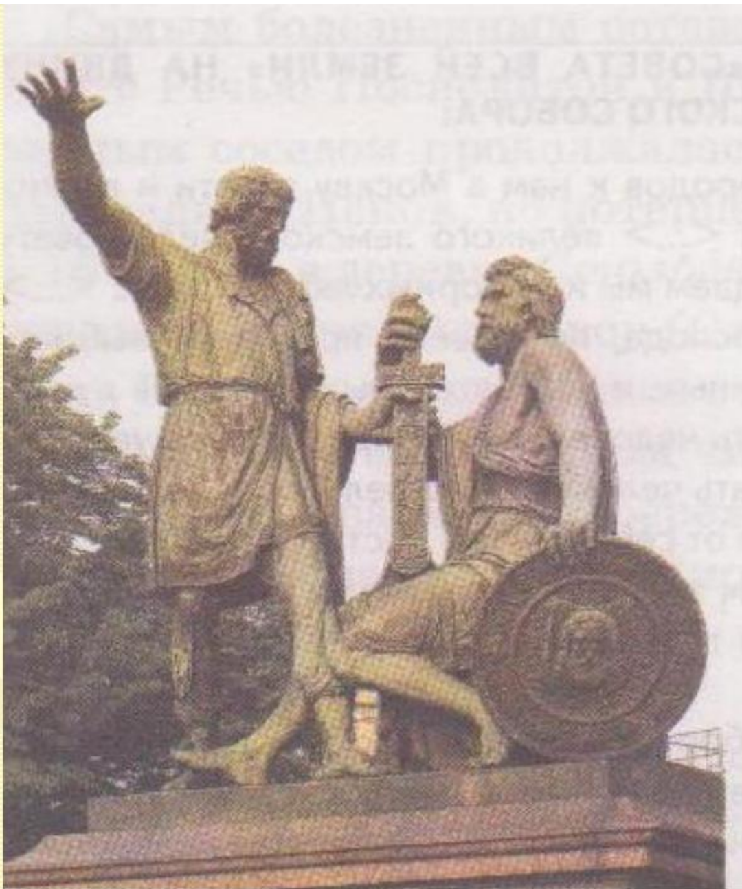
Памятник Минину и Пожарскому. Москва. Скульптор И.П. Мартос.