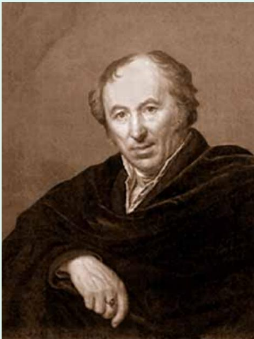
Иван Петрович Мартос (1754-1835 гг.)