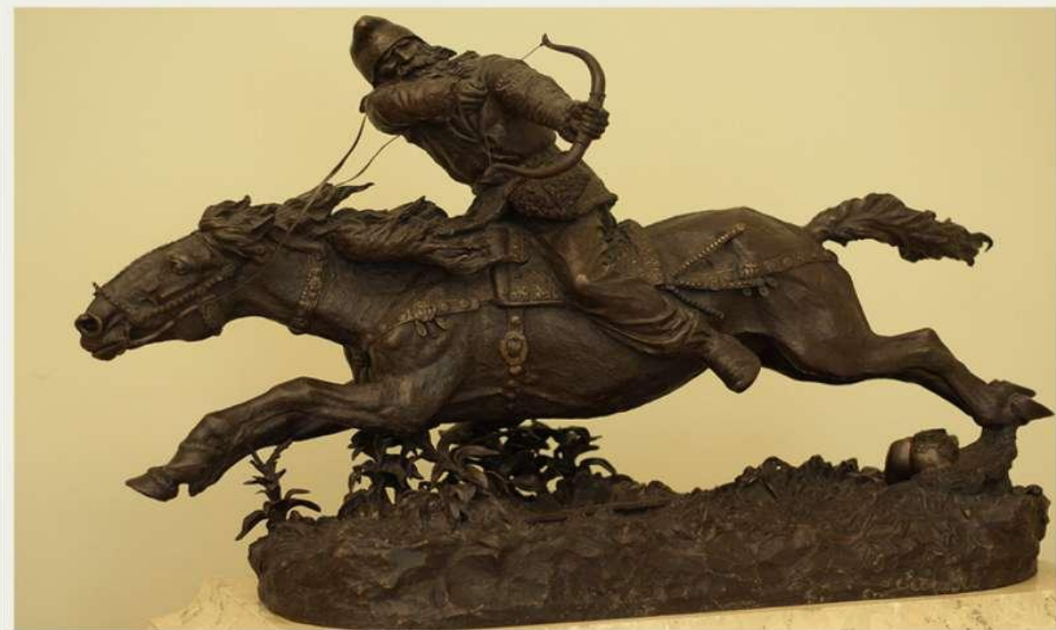
«Скіф», 1889 р. Російський музей.