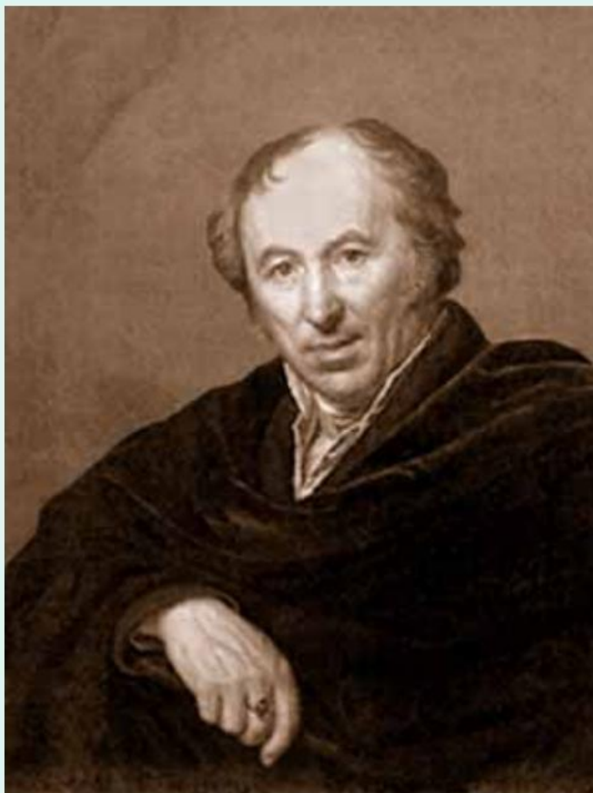
Иван Петрович Мартос (1754-1835 гг.)