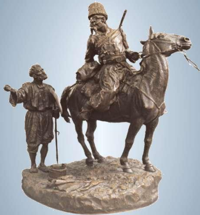
Скульптурна композиція «Запорожець у розвідці» (1887р.)