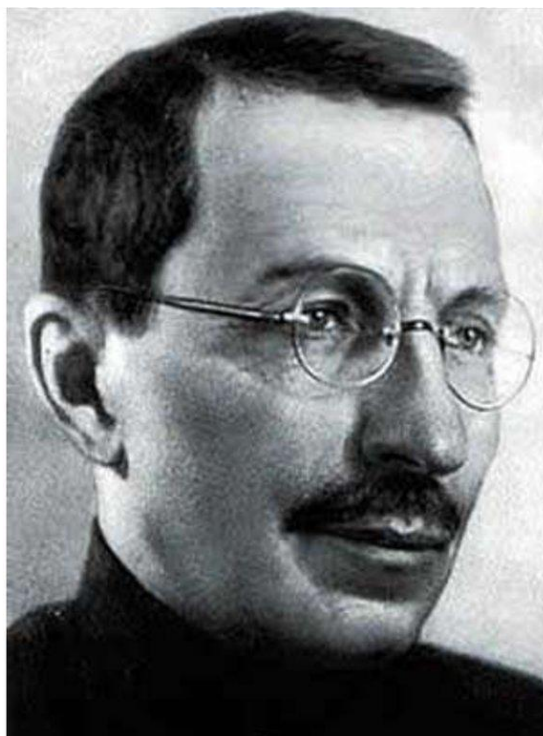
А. С . Макаренко