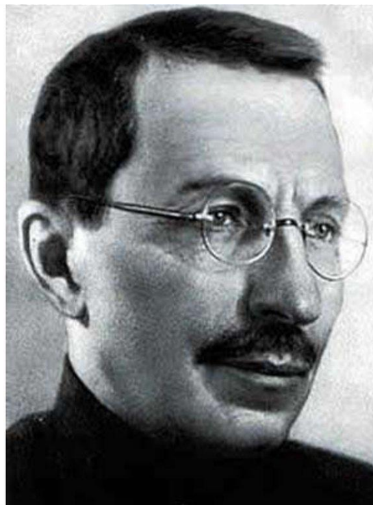
А. С . Макаренко