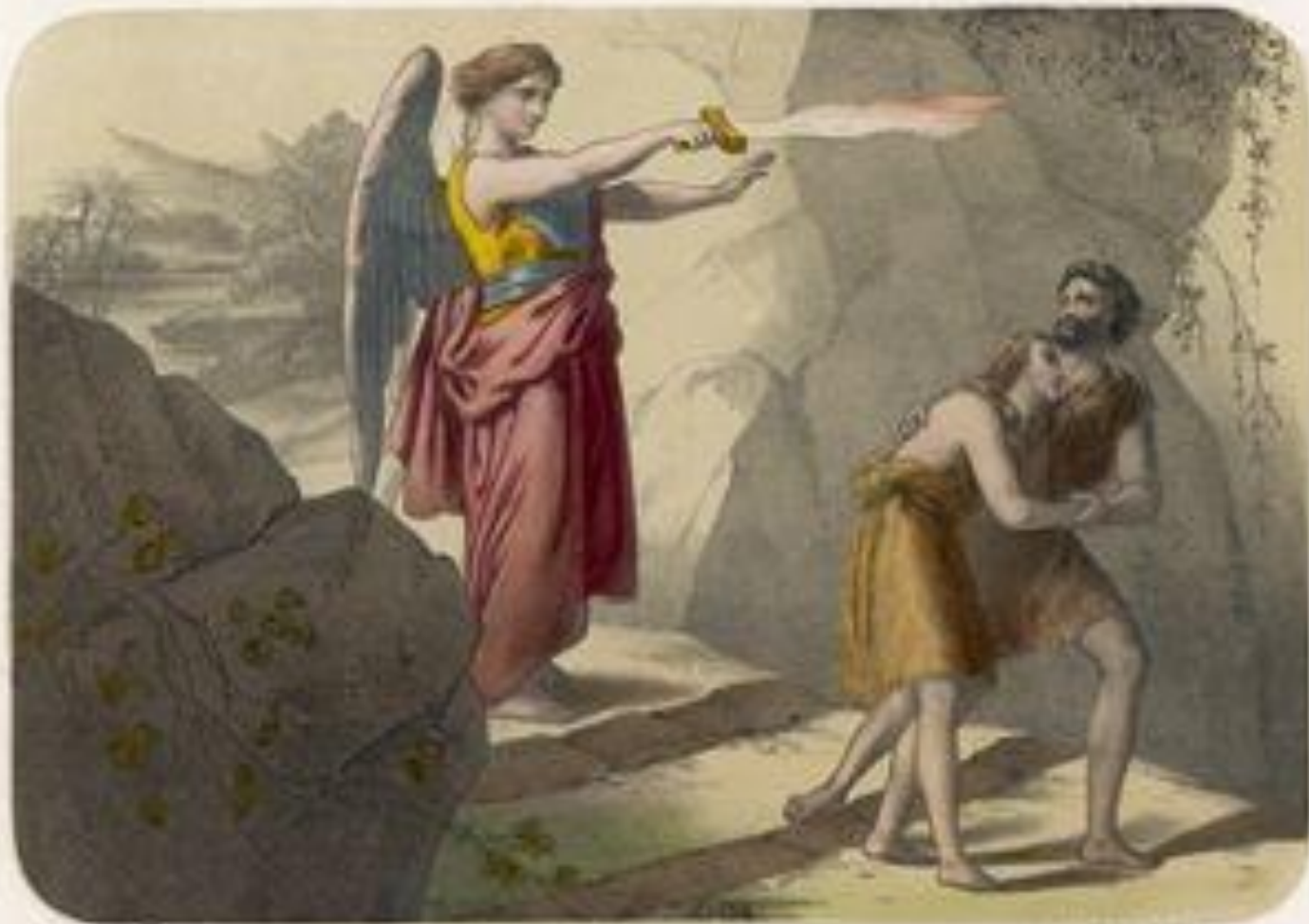
LE PARADIS PERDU

И выслал Бог Адама и Еву из Рая. А перед его входом поставил ангела с огненным мечом.