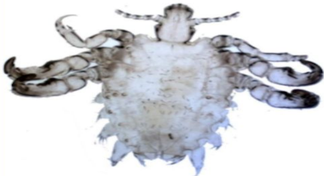
Вошь лобковая ( Phthirus pubis ).