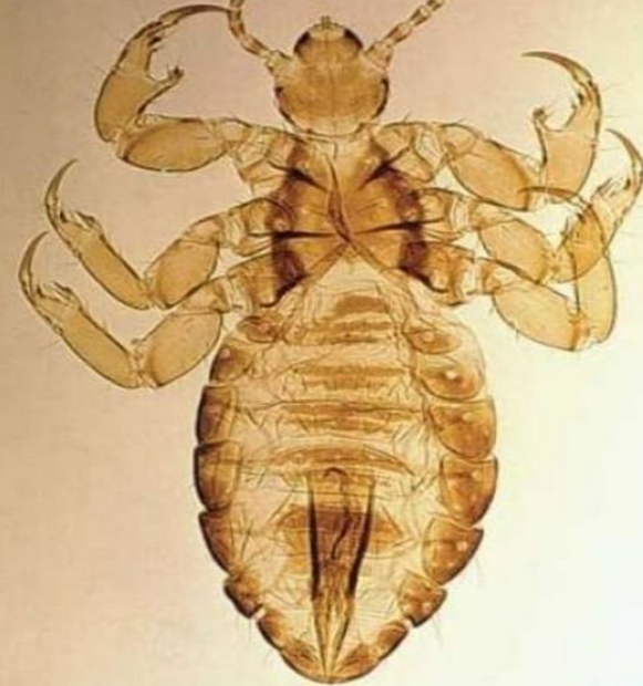
Платяная вошь Pediculus humanus humanus