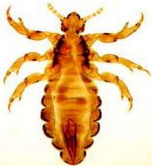
Головная вошь Pediculus humanus capitis