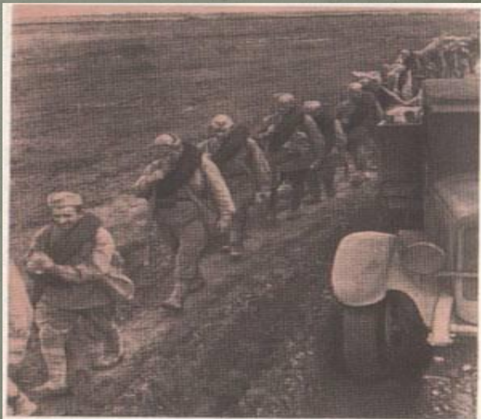
Фронтальная дорога.