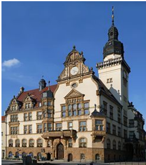
Ратуша города Вердау в Саксонии