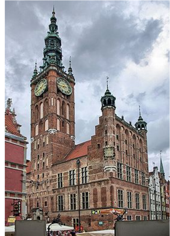
Ратуша города Гданьск в Польше