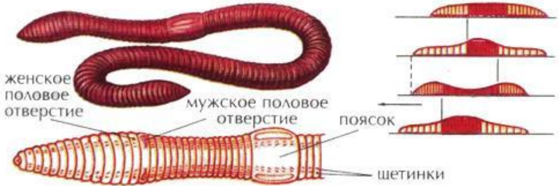
Рисунок № 1 – внешнее строение дождевого червя