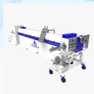
ЭКСТРУДЕРЫ ДЛЯ ПОЛИМЕРОВ