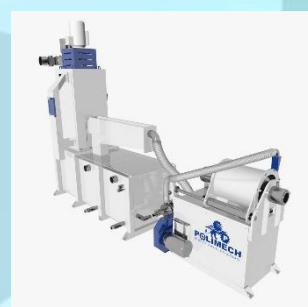
ГРАНУЛЯТОРЫ ДЛЯ ПЛАСТИКА