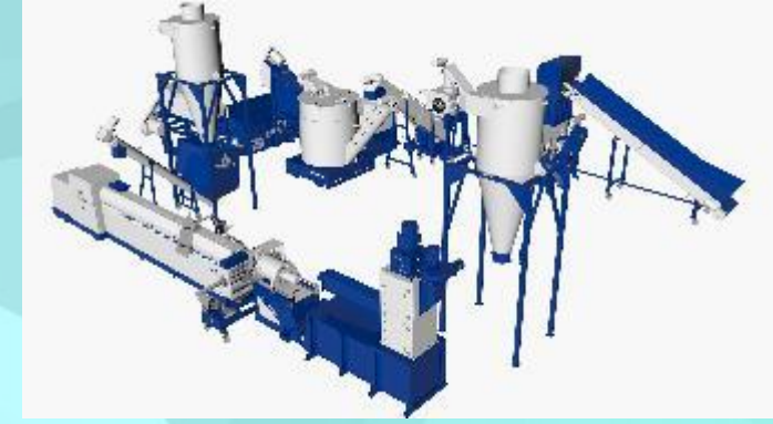
КОМПЛЕКС ДЛЯ ПЕРЕРАБОТКИ ТВЕРДОГО ПЛАСТИКА