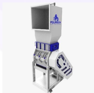
ДРОБИЛКИ ДЛЯ ИЗМЕЛЬЧЕНИЯ ПЛАСТМАСС