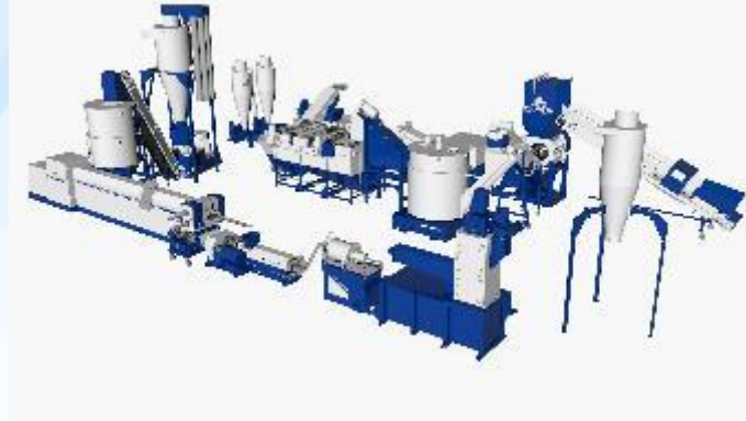
КОМПЛЕКС ДЛЯ ПЕРЕРАБОТКИ ПЛЕНОЧНЫХ МАТЕРИАЛОВ