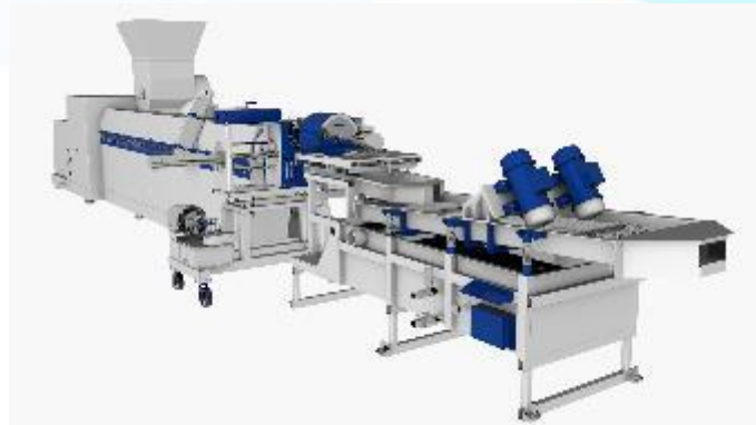
ЛИНИЯ ГРАНУЛЯЦИИ ПОЛИКАРБОНАТА