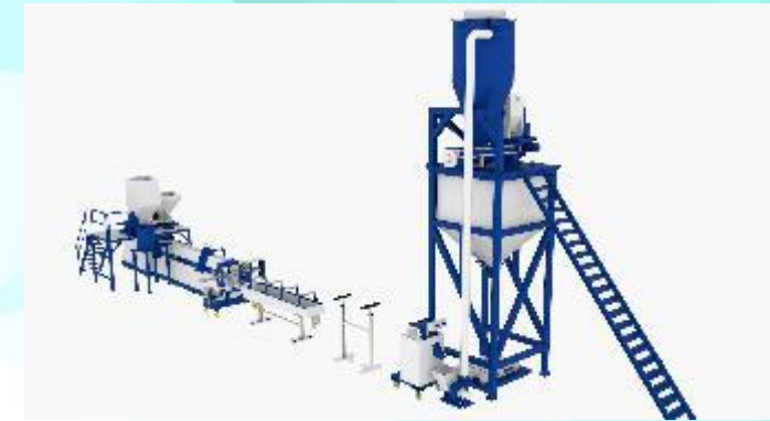
ЛИНИЯ ГРАНУЛЯЦИИ ТЭП