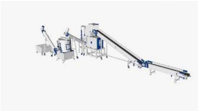
ЛИНИЯ ПОДАЧИ И ДРОБЛЕНИЯ БРИКЕТОВ КАУЧУКА