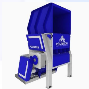
ШРЕДЕРЫ ДЛЯ ИЗМЕЛЬЧЕНИЯ ПЛАСТМАСС