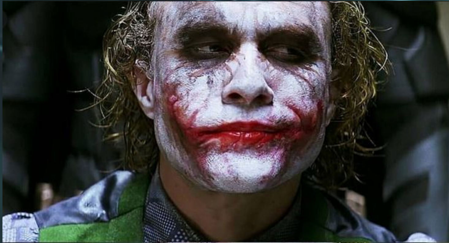
The Dark Knight

Якщо на співорозмовника дивляться мало, він має всі підстави вважати, що до нього або до того, що він говорить і робить, відносяться погано, і навпаки.