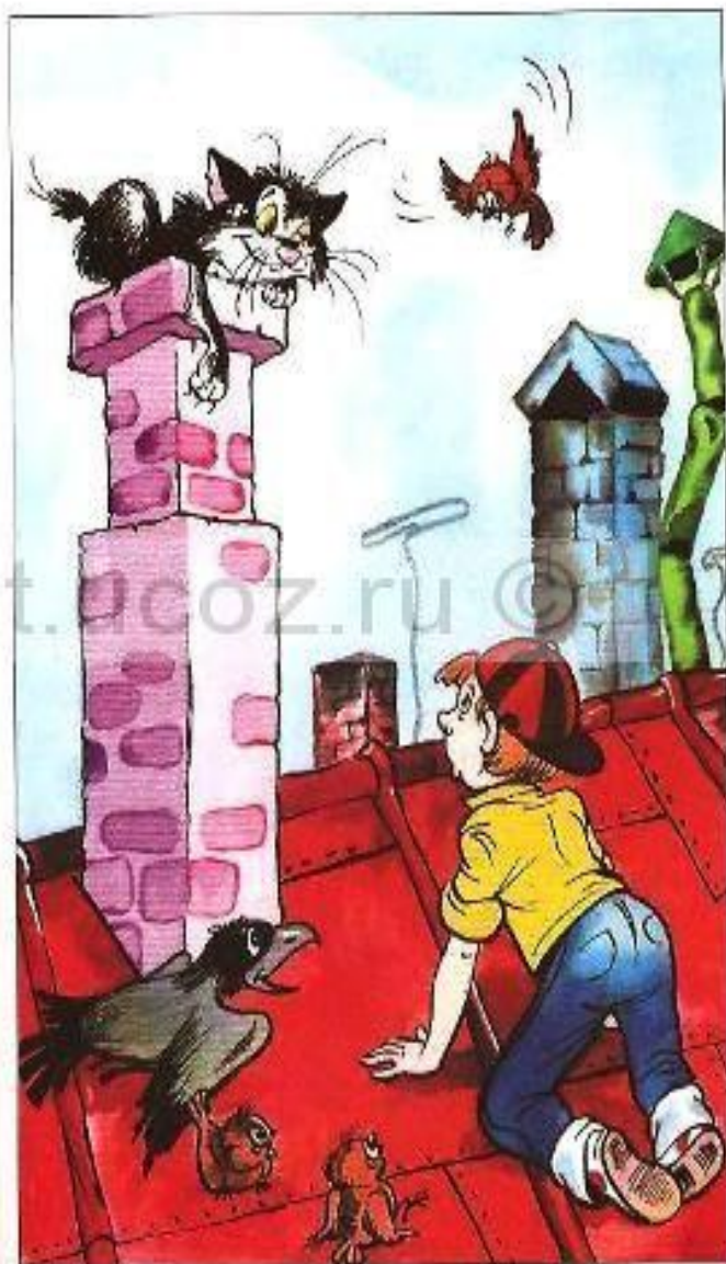
Тут Иван увидел символы своего падения — кота Банду, (Глава четвертая)

— Пер-двинуть его надо в сторону! — крикнул Алик.