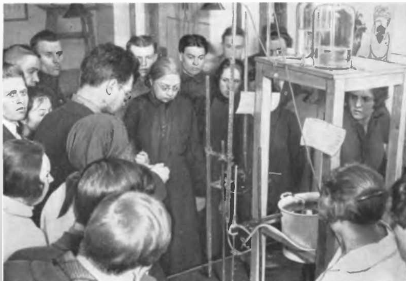
Н.К. Крупская осматривает биологический кабинет в новой школе. Москва. 1931 г.