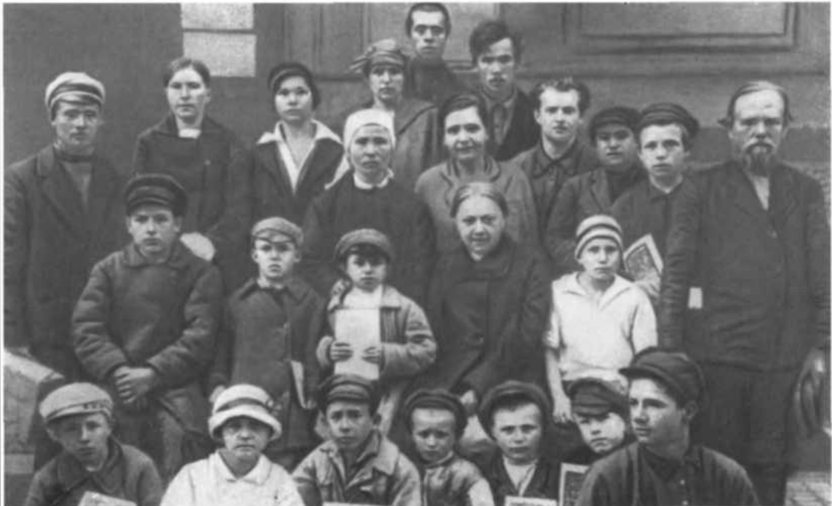
Н.К. Крупская среди активистов избы— читальни .1925 г.