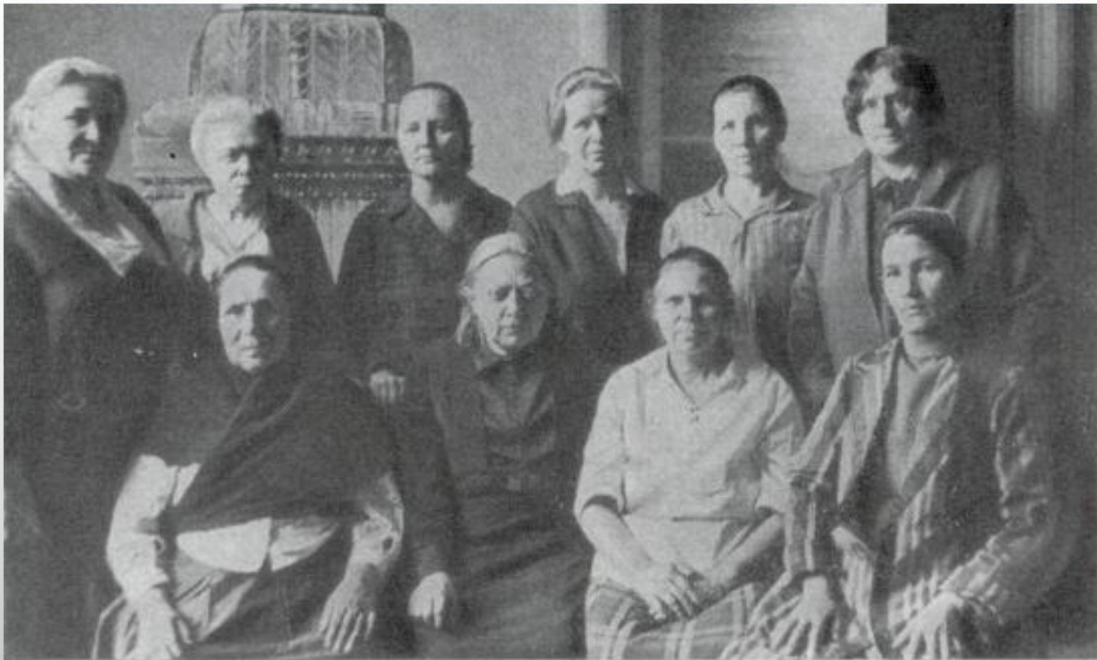
Н.К. Крупская и М.И. Ульянова среди работниц «Трехгорной мануфактуры» и фабрики «Интернационал» (Владимирская губерния), приветствовавших XV съезд ВКН(б). 1927г.