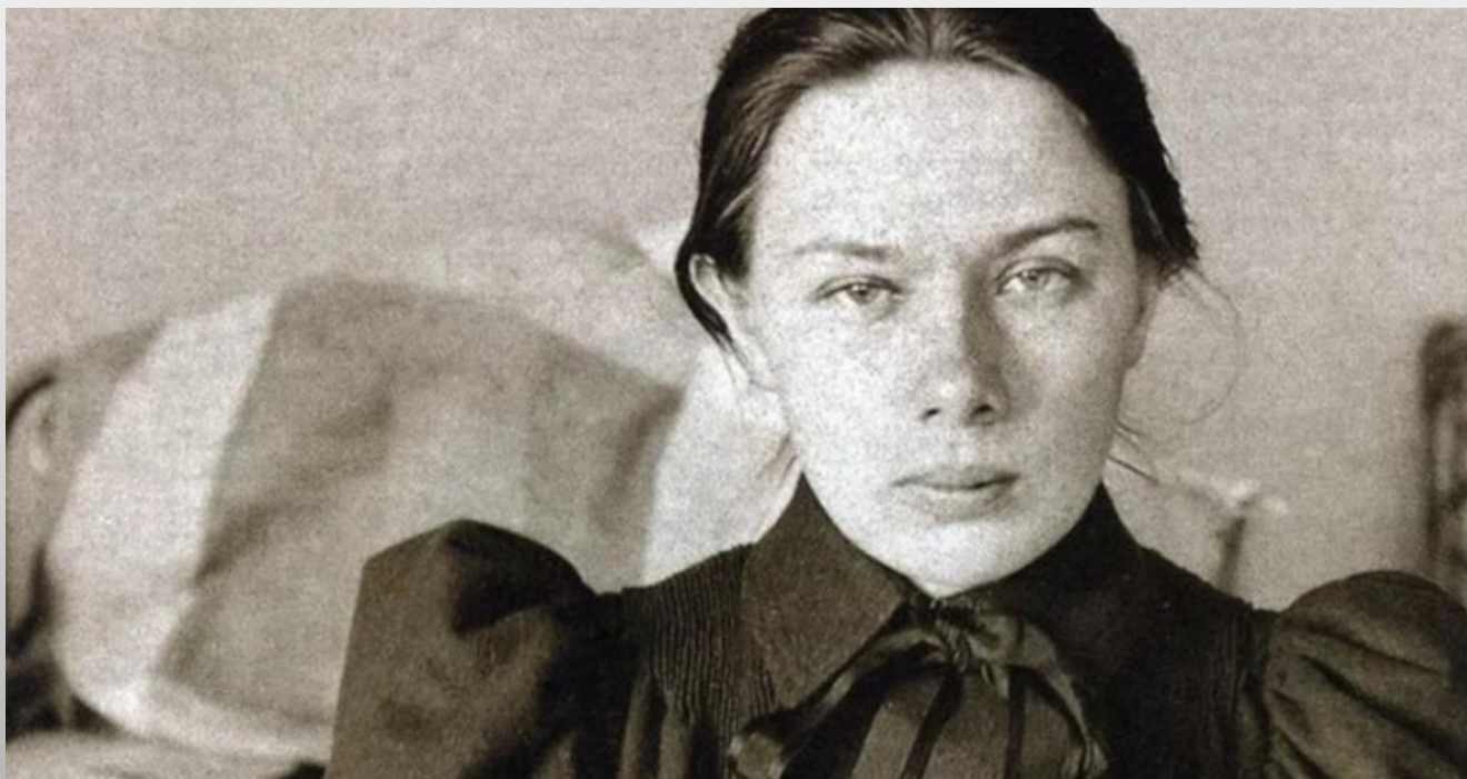
Н.К. Крупская - учительница Смоленской вечерне-воскресной школы в Петербурге. 1890–е годы