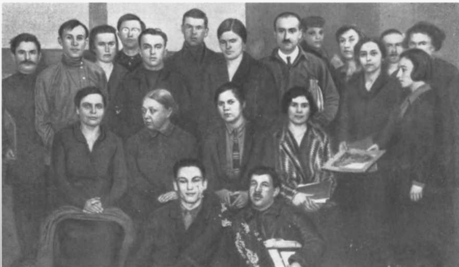
Н.К. Крупская на I Всероссийском съезде избачей .1927 г.