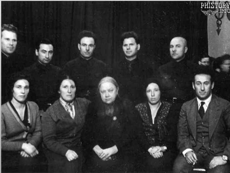
Надежда Крупская в Наркомпросе . Москва. СССР. 1936 г.

С первых же дней установления Советской власти Н.К. Крупская была направлена Коммунистической партией на работу в только что созданный Наркомпрос в качестве руководителя внешкольного отдела.