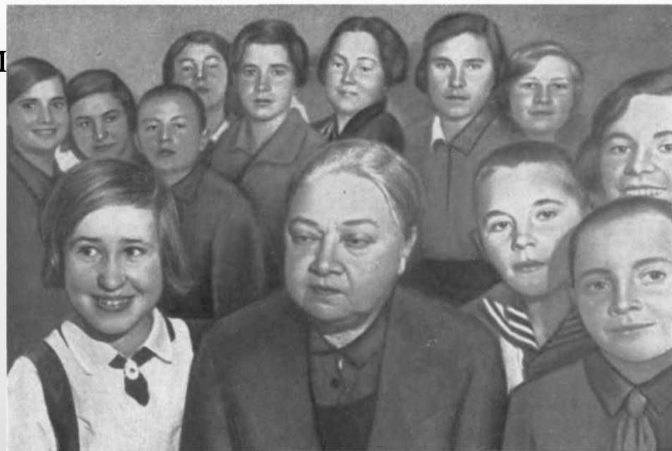
Крупская среди пионеров

В 1922 г. Н.К. Крупская стала бессменным ответственным редактором журнала «На путях к новой школе», сыгравшего большую роль в строительстве советской школы и в развитии марксистской педагогики.