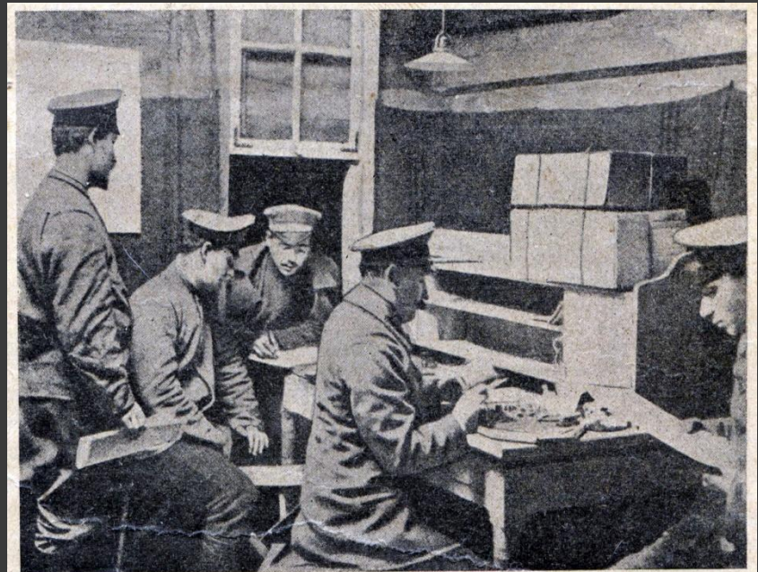
Просмотр корреспонденции съ театра войны военной цензурой.