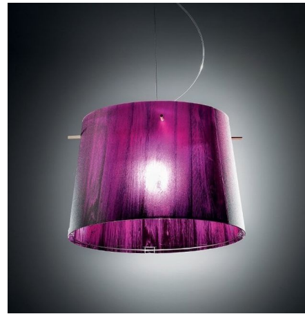
Люстра из термопластика яркого цвета и простой формы добавит экспрессии в эклектику, не вступая в конфронтацию с другими предметами интерьера