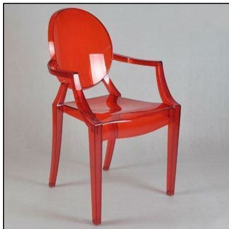
Иронию Филиппа Старка над стилем Людовика XVI можно увидеть в стуле с классическими формами из современного материала поликарбоната