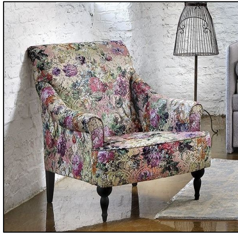
Стилизованная классика и россыпь цветов и цвета в этом кресле созданы для очень женственной эклектики