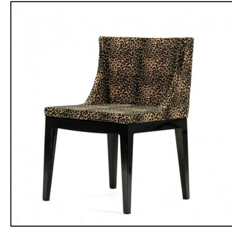
Современность и ар-деко – почему бы и нет?