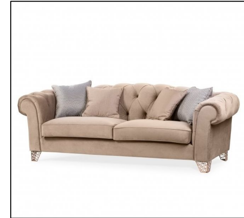
У бархатного дивана с элементами пикировки должны быть изогнутые ножки, но вместо них – изящные, словно переплетенные из стали, которые делают диван воздушным