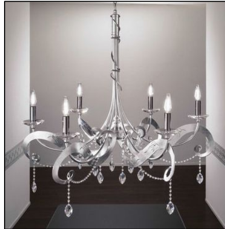
Стилизованные свечи, хрусталь, нотки романской эпохи: такая люстра – отличное решение для эклектичной гостиной