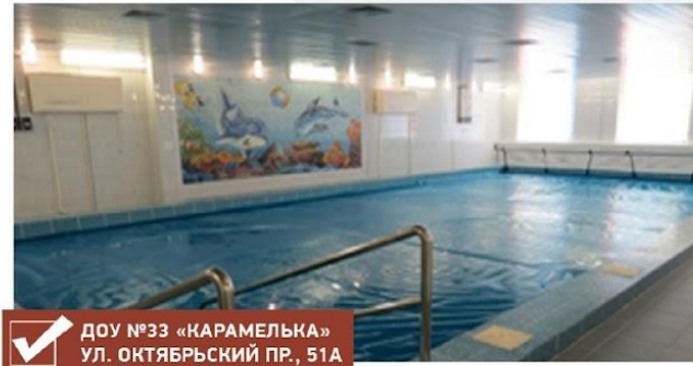
✓ ДОУ №33 «КАРАМЕЛЬКА» УЛ. ОКТЯБРЬСКИЙ ПР., 51А