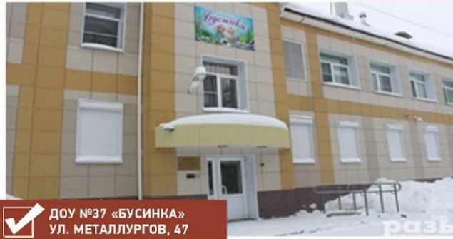
✓ ДОУ №37 «БУСИНКА» УЛ. МЕТАЛЛУРГОВ, 47