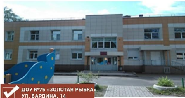
✓ ДОУ №75 «ЗОЛОТАЯ РЫБКА» УЛ. БАРДИНА, 14