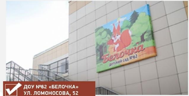
✓ ДОУ №62 «БЕЛОЧКА» УЛ. ЛОМОНОСОВА, 52