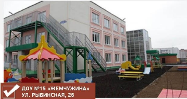
✓ ДОУ №15 «ЖЕМЧУЖИНА» УЛ. РЫБИНСКАЯ, 26