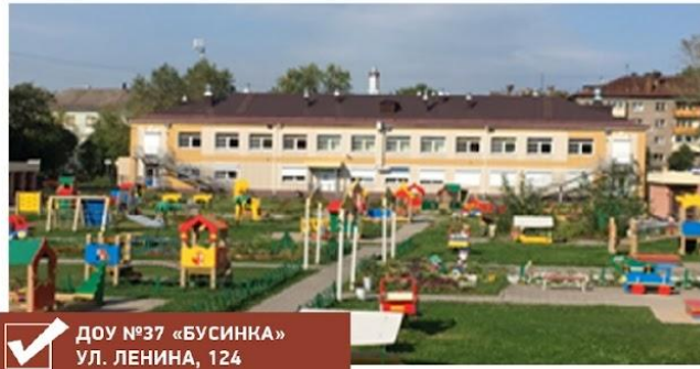
✓ ДОУ №37 «БУСИНКА» УЛ. ЛЕНИНА, 124