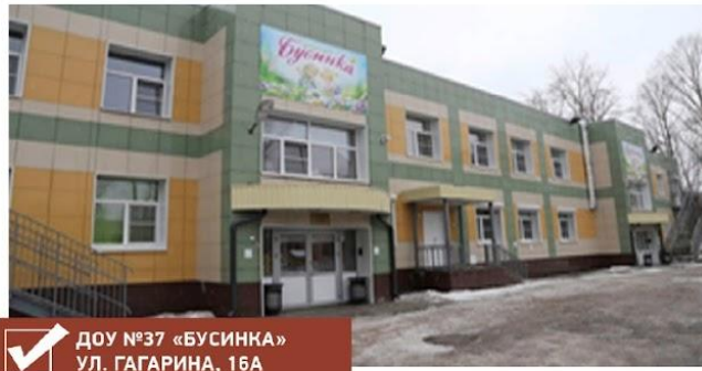
✓ ДОУ №37 «БУСИНКА» УЛ. ГАГАРИНА, 16А