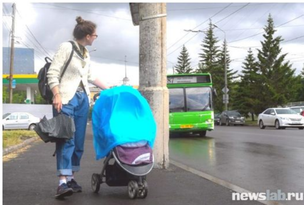
Я, коляска и общественный транспорт

Начать я решила с 31-го маршрута, который из Академгородка едет аж до правобережного ЛДК. Еще одна его особенность — только на нем можно доехать до Николаевского (четвертого) моста. Одна беда — ни один автобус на этой линии сейчас не приспособлен для инвалидов и матерей с колясками. Автобусная реформа привела к тому, что маршрут «почистили» от низкопольных ЛиАзов. Не вру, можете сами проверить в онлайн-сервисе пассажирского транспорта.