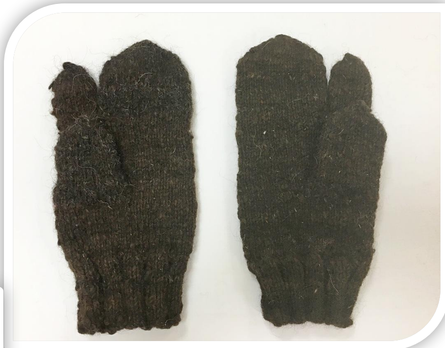
Мастер Никонова Ольга Александровна, с. Колежма

На выставке представлены рукавицы из неокрашенной овечьей шерсти, выполненные традиционным способом кругового вязания на 5 спицах, но указательный палец вывязан отдельно. Такие изделия домашние мастерицы вязали для мужчин, выполняющих разные работы в зимнее время на улице, - для охотников, рыбаков; в военное время – для солдат - стрелков.