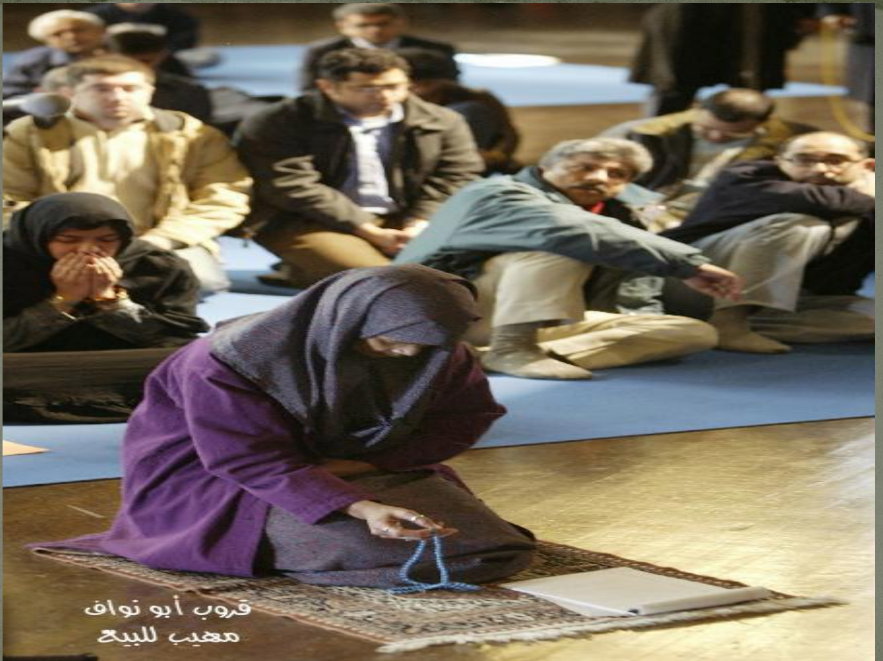
قروب أبو نواف مغيب للبيح