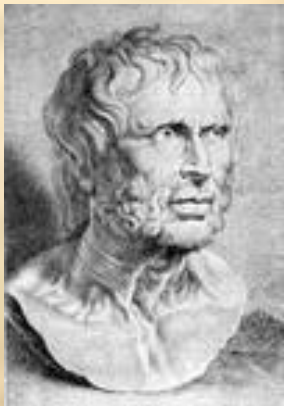
римский философ Сенека

«...большая часть нашей жизни уходит на ошибки и дурные поступки, значительная часть протекает в бездействии и почти вся жизнь в том, что мы делаем не то, что надо»