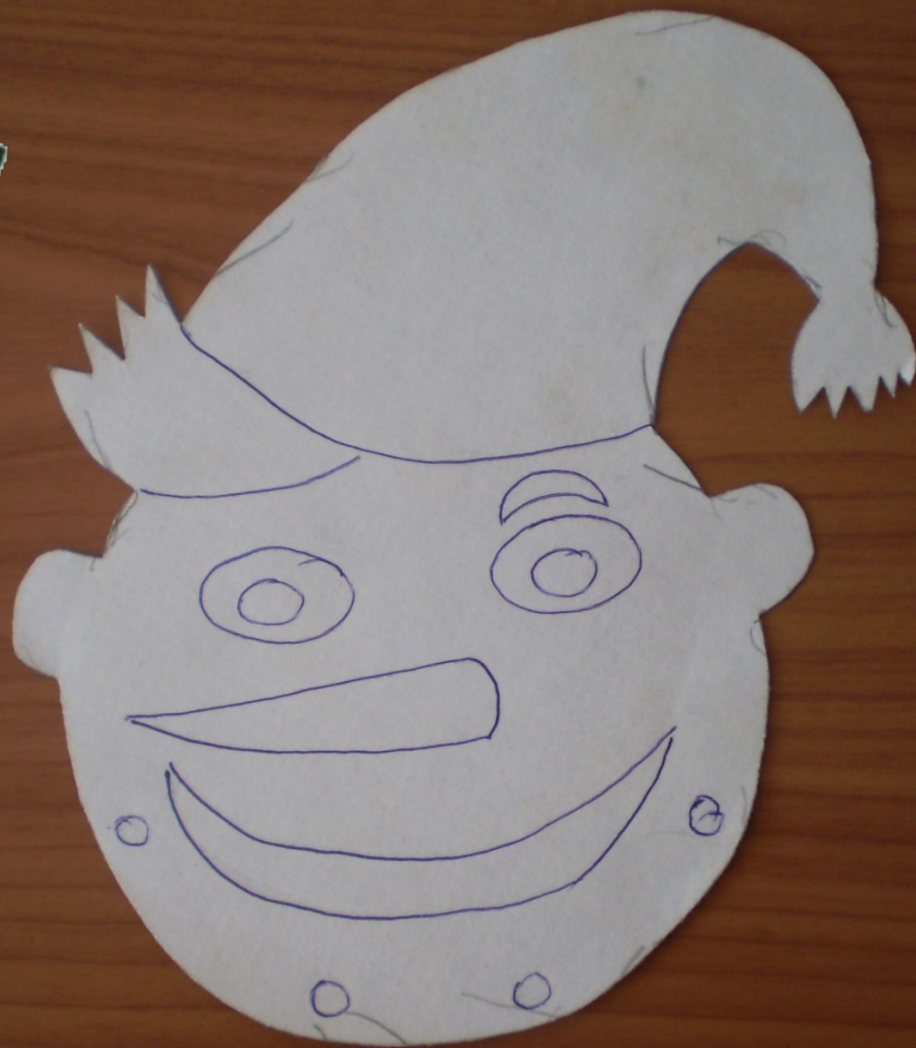
Схема лица игрушки