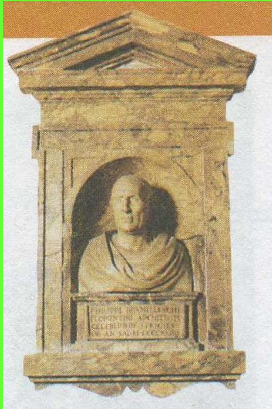
Филиппо Брунелески (1377-1446)