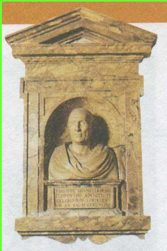
Филиппо Брунелески (1377-1446)