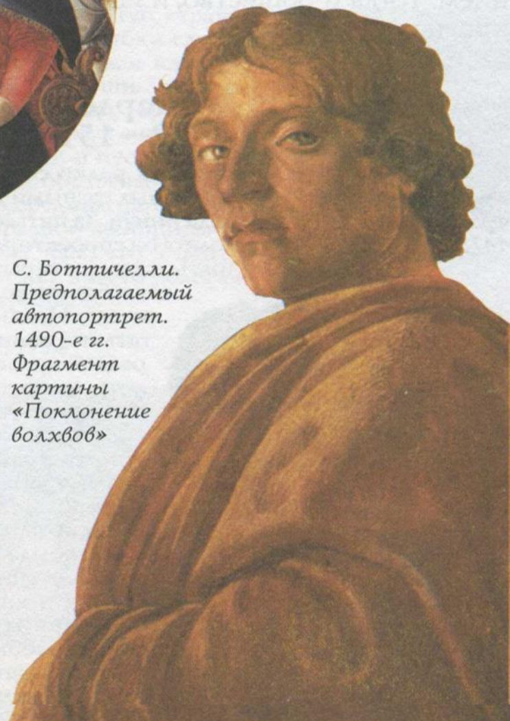
С. Боттичелли. Предполагаемый автопортрет. 1490-е гг. Фрагмент картины «Поклонение волхвов»

ала дерзкой, сильной личности, того идеала, которому он поклонялся в молодости. Художник оставляет и живопись. Он прожил еще 5—6 лет в одиночестве и отчаянии, но уже ничего не совершил для искусства.