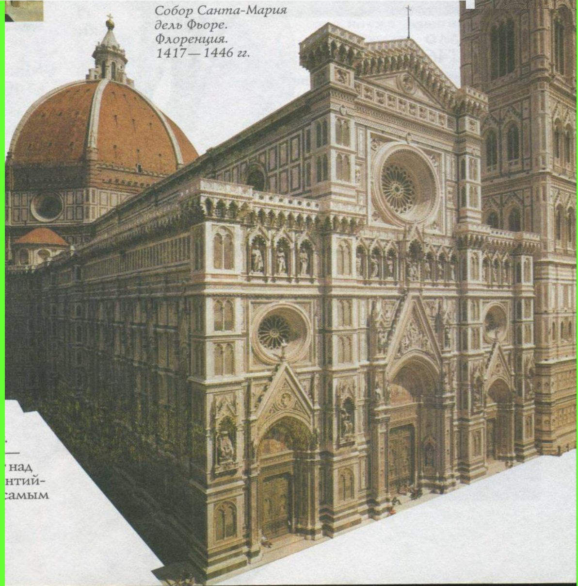
Собор Санта-Мария дель Фьоре. Флоренция. 1417—1446 гг.