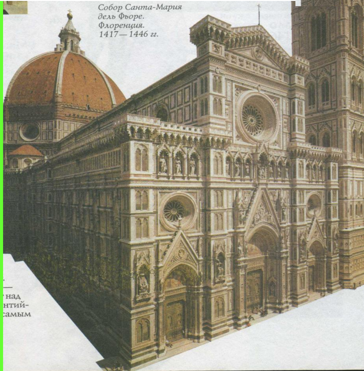
Собор Санта-Мария дель Фьоре. Флоренция. 1417—1446 гг.