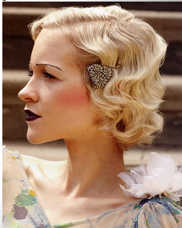
Прическа нашего времени в стиле ретро