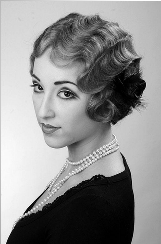
Прическа в стиле ретро 20-х годов XX века