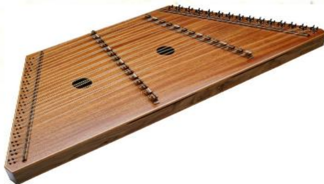
Гусли – древнерусский щипковый инструмент