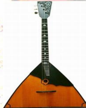
Балалайка – струнный щипковый инструмент. Это музыкальный символ русского народа.