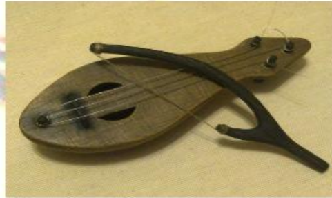
Гудок – древнерусский смычковый инструмент