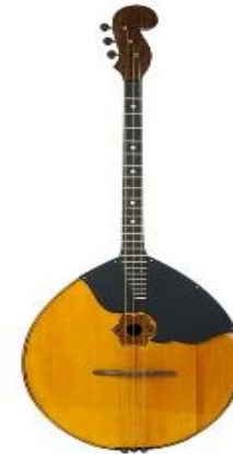
Домра – старинный русский щипковый инструмент