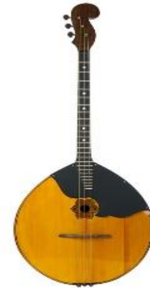
Домра – старинный русский щипковый инструмент