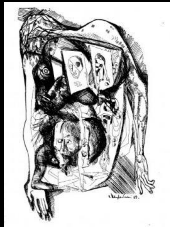
«Внутренний мир Свидригайлова» Э. Неизвестный