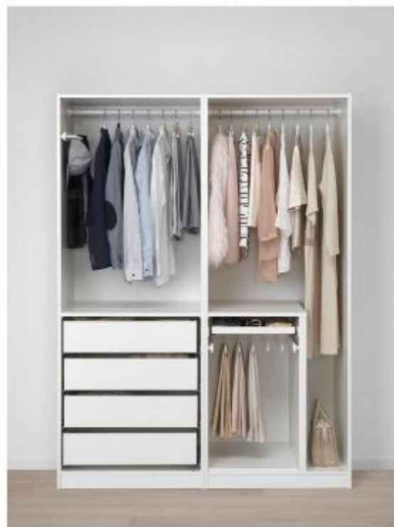
одежда, которую мы в нем храним, - содержание