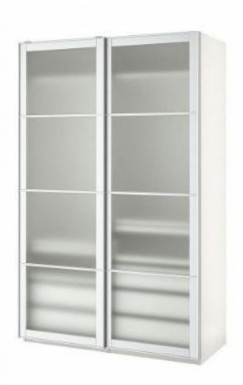
шкаф - это форма