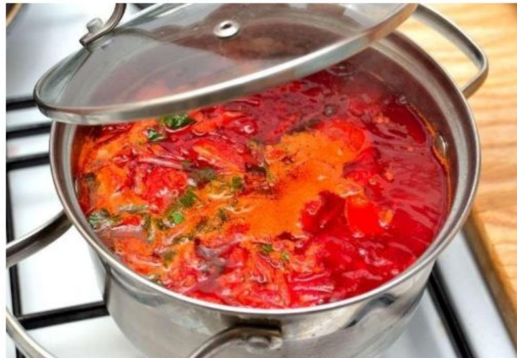
блюдо, которое мы в ней приготовили, - содержание