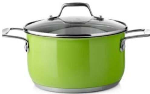
кастрюля - это форма