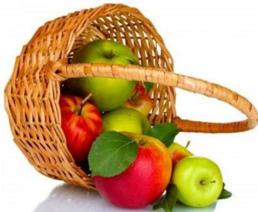
яблоки, которые мы в нее сложили, - содержание