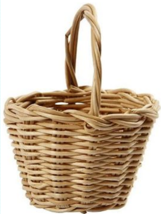
корзинка - это форма